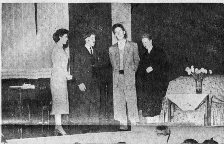
PRIZOR IZ IGRE »ČLOVEK, KI JE UMORIL«, KI SO JO UPRIZORILI BAZOVCI PRVIČ V BAZOVICI IN DRUGIČ V MARIJANIŠČU NA OPCINAH

Zato naj se starši zavedajo svoje dolžnosti, da otrokom ne bodo dali v roke takih spisov.