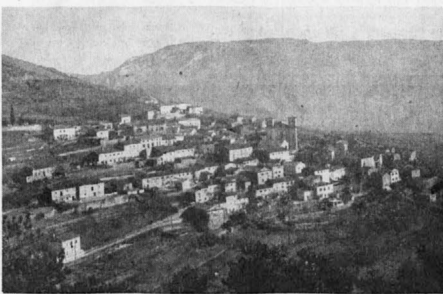
RICMANJE — LEPA VAS V TRŽAŠKI OKOLICI Z ZNANIM SVETIŠČEM SV. JOZEFA

V Avstraliji, kjer je tudi mnogo naših rojakov, so imeli v nedeljo volitve. Zmagali sta liberalna in agrarna stranka, ki sestavljata vladno koalicijo. Ministrski predsednik Menzies je zdaj že četrty zmagal. Dobil je celo deset poslanskih mest več kot jih je imel prej, in sicer na škodo laburistov.