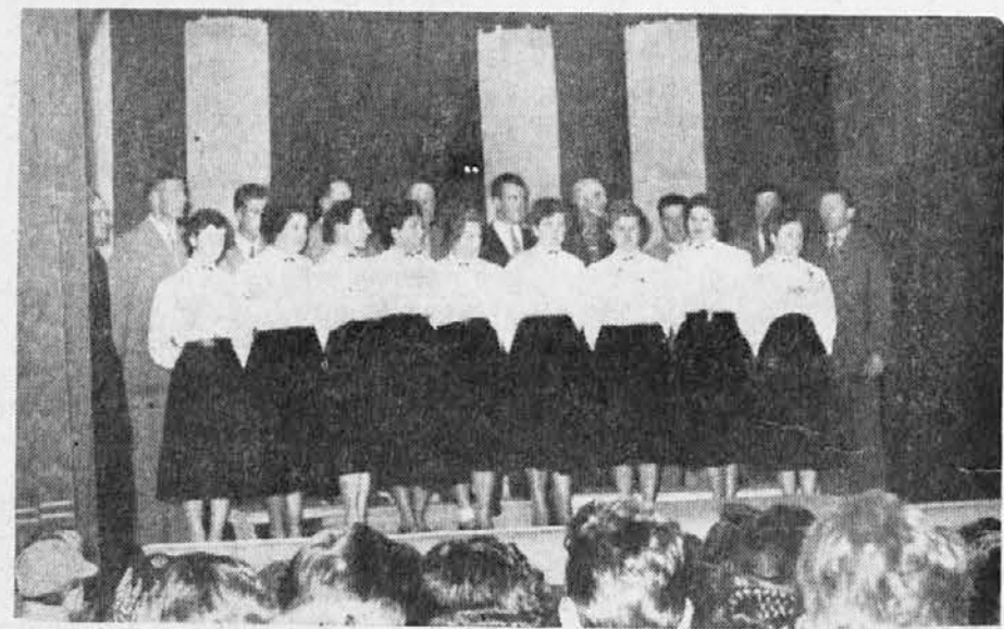
ZBOR IZ GROPADE, KI JE PRVIČ NASTOPIJ V FARNI DVORANI V BAZOVICI ZADNJO NEDELJO NOVEMBRA. — GROPADE ŠTEJE KOMAJ 30 DRUŽIN