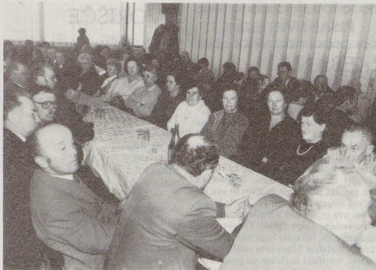
Upokojenci zavzeto poslušajo svoje predstavnike o svojem delu in kujejo načrte v prihodnje