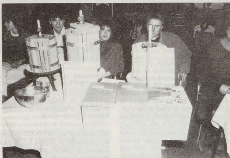
Bogate nagrade so 1. mesto na kvizu AMZ ekipi Trnave bogato poplačale