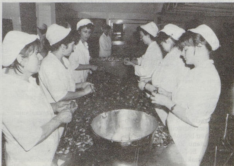
Samopostrežna Celje. Še vedno ročno lupljenje krompirja?