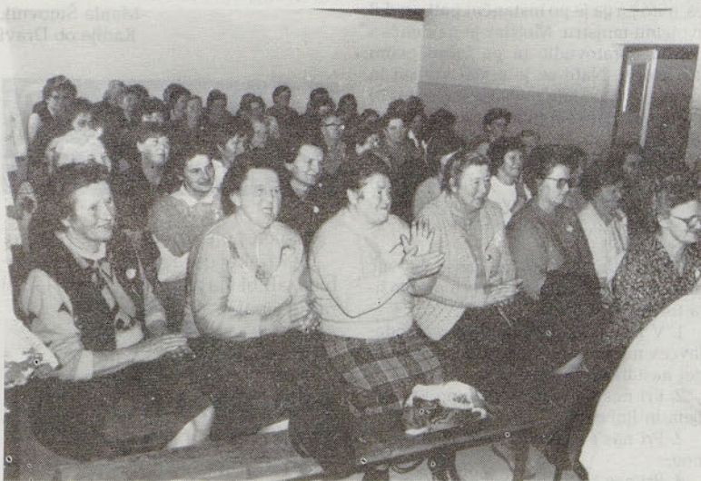
in te so jih ganjene nagradile z glasnim ploskanjem