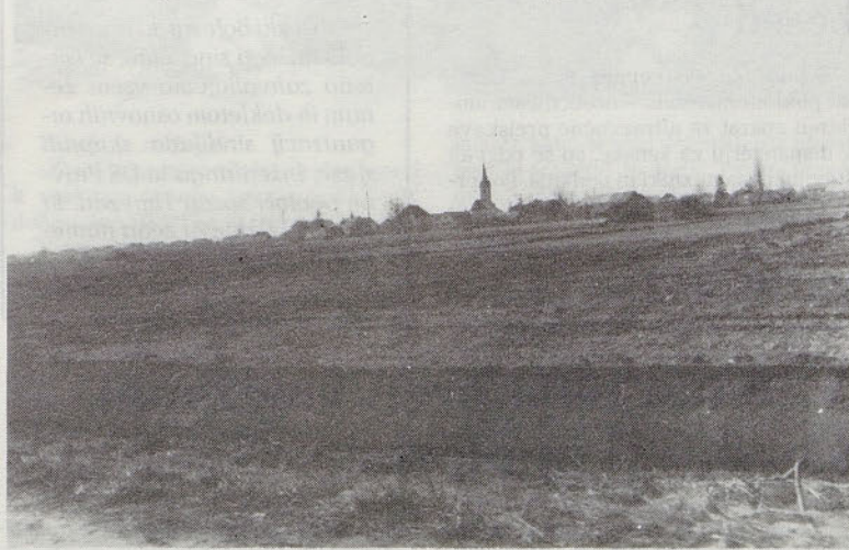
Polje vzhodno od Gotovelj so drenažirali