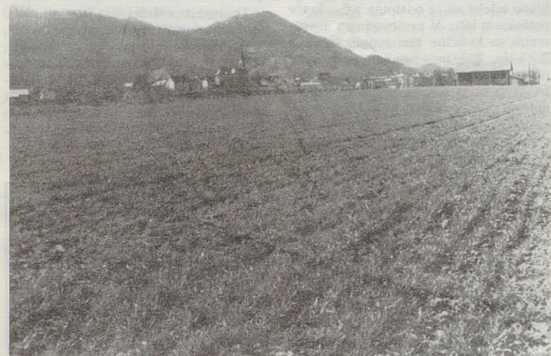
Kazalo je, da je suha zima uničila žita. Le-ta so po dežju lepo ozelenela in se razrastla