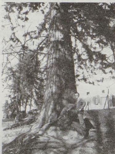
Doglazija na Plevnem