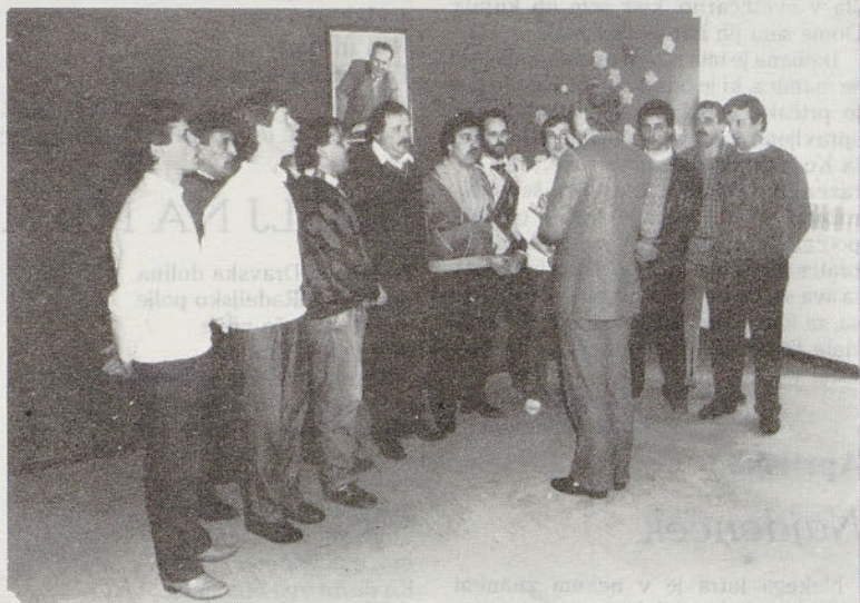
Na TZO Šempeter so kmečki fantje ob 8. marcu zapeli svojim mamam, ženam in dekletom ...