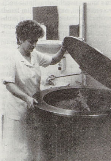
Mmm – kako diši