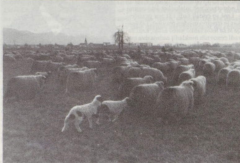
Trije pastirji iz okolice Foče so sredi februarja pasli svojo 400 glavo čredo ovc skozi Savinjsko dolino in se več dni zadržali na pašnikih nad Polzelo