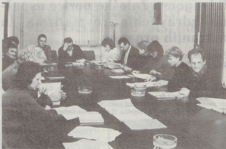
Zbor delegatov HKS

V VEČINI PRIMEROV KADROVSKA STRUKTURA NI USTREZNA