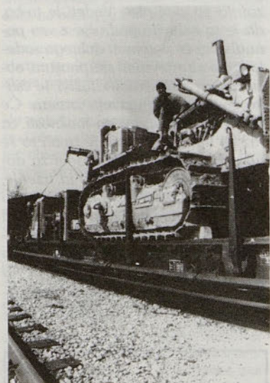
Strojna, TOZD Grames je poslala svoja dva velika buldožerja Catenpillarja s posadko v Kakanj na površinski kop rjavega premoga