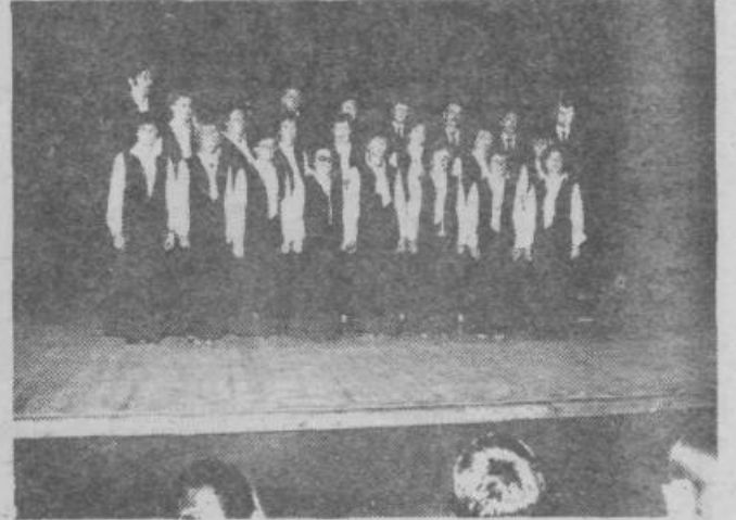
Mešani pevski zbor DKD Svoboda Zalog ob prvem nastopu v novem kulturnem domu Španski borci.