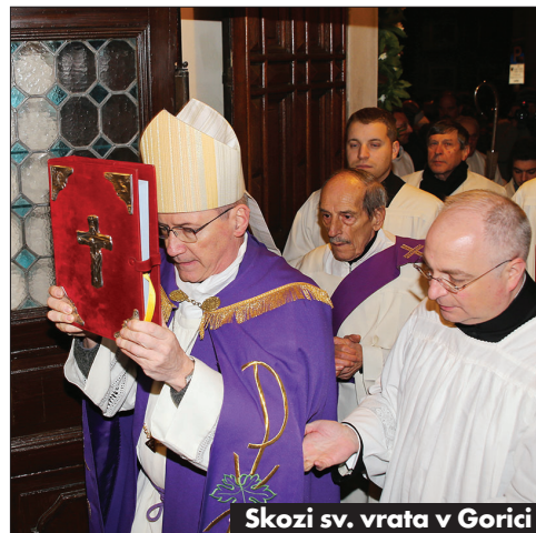
Skozi sv. vrata v Gorici

ideološki boj izpred 70 let, odpuščati in si prizadevati za slovo in mir; o tem, kako se vodi manjše družinsko podjetje, ki kljub gospodarski krizi nudi zaposlitev in oporo na rob družbe odrinje-