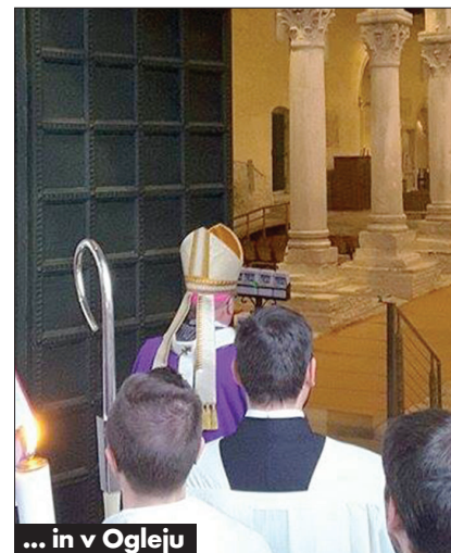
... in v Ogleju