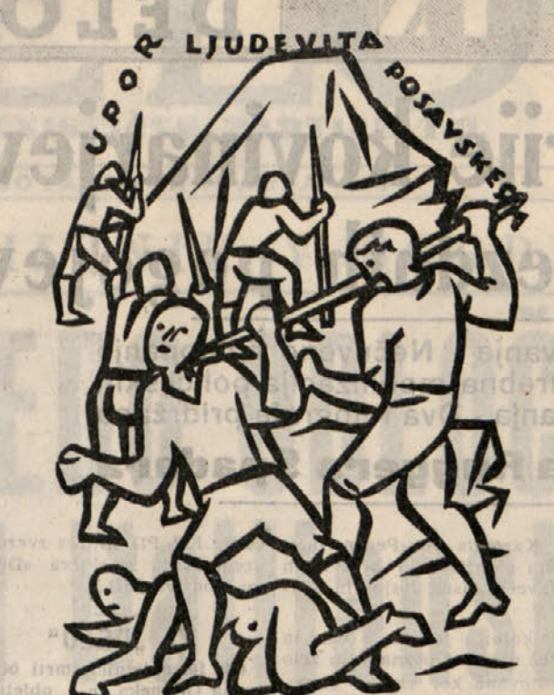
Akademska slika Avgust Cernigaj je opremil naslovno stran in dvanajst mesecev Ljudskega koledarja 1955 s serijo umetniških slik iz slovenske zgodovine. Gornja slika nam prikazuje upor Slovencev in Hrvatov pod vodstvom Ljudevita Posavskega proti nadoblasti Frankov