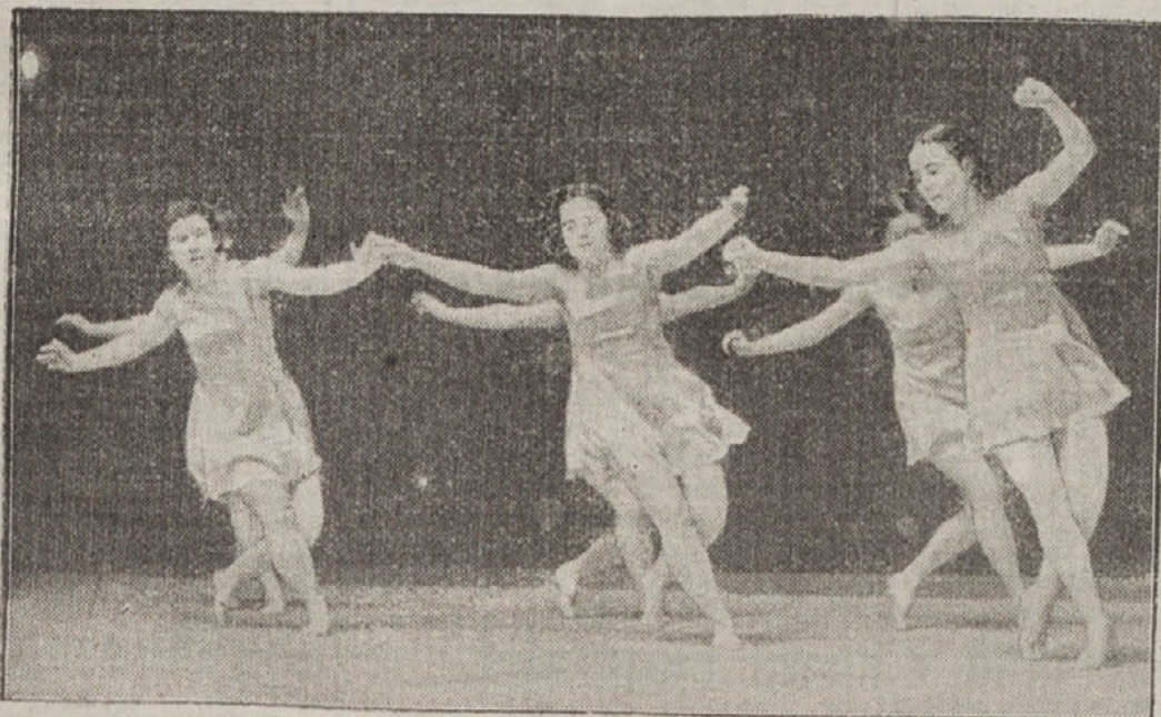
V Nemčiji so začeli z velikopotezno akcijo, s katero hočejo pridobiti zanimanje najširših slojev za telesno kulturo. Od mesta do mesta potujejo učenke šol za gimnastiko in ritmiko in z nastopi kažejo občinstvu lepoto gimnastičnih vaj

— Ali bo ta zamka veljala tudi še jutri?