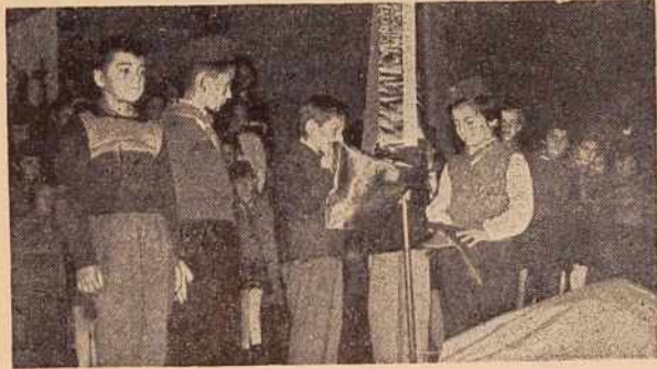
S sprejema o pionirsko organizacijo

Vse to je Kajuhov odred pravilno dojel. Pod vodstvom starejšinskega sveta in učiteljev ter vodij krožkov je dosegal iz leta v leto boljše uspehe. Del teh svojih uspehov hodo pokazali na akademiji v soboto, 23. aprila ob 18. uri v dvorani kina Park.