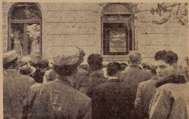
Ob začetku kongresa pred televizijskim sprejemnikom Hotela »Zvezda«

Ob takem načinu dela v Socialistični zvezi ugotavljamo, da vlada na območju našega okraja pozitivno razpoloženje kmetijskih proizvajalcev za sodoben, napreden, ekonomsko donosnejši način kmetijske proizvodnje. So še slabosti, ki izhajajo iz materialnih težav, iz pomanjkanja dovolj izkušenih kmetijskih kadrov, kar pogostokrat tudi kvarno vpliva na kakovost kmetijske proizvodnje. Vendar so uspehi že taki in tako prepričljivi, da trenutne pomanjkljivosti k na-