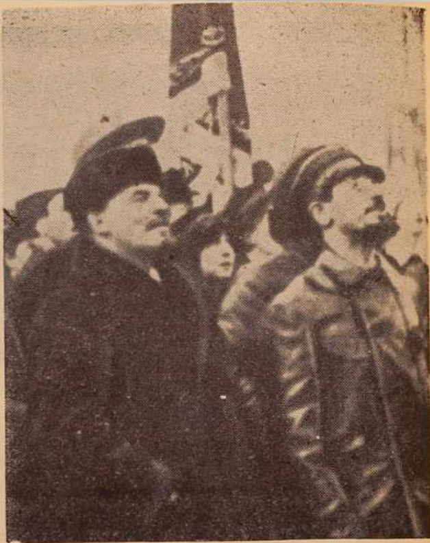
Lenin in Sverdlov na velikem zborovanju v Petrogradu, 7. nov. 1918

Z oktobrsko revolucijo se je uresničil davni Leninov sen, hkrati pa mu je pomenila začetek še intenzivnejšega dela in še težje borbe. Na njegova ramena je padlo vodstvo države, ki je bila upušča in so jo razjedali upori kontrarevo-