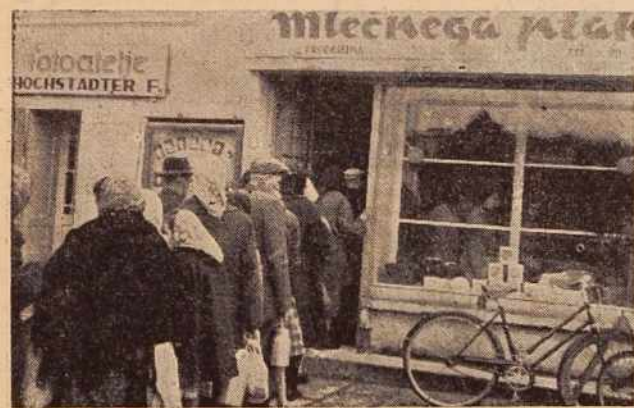
Ob sobotah taki prizori pred soboško mlekarno niso redki. Naše gospodinjje že težko čakajo na novo, sodobno urejeno in nekoliko večjo mlekarno v Štefana Kovača ulici.

Delo nam je znano pod podobnim naslovom tudi že z odrskih desk. Film pa je bil pred tremi leti preselečen v berlinskega festivala. Čeprav ustvaritev dočel neznanega režiserja, je bil film kasneje v mnogih državah izbran za najboljši film leta. Film sodi med tista dela, ki