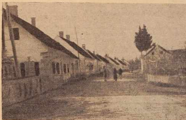
Mota na Murskem polju