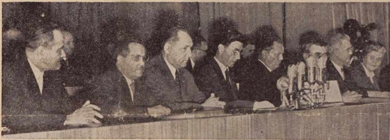
Delovno predsedstvo kongresa