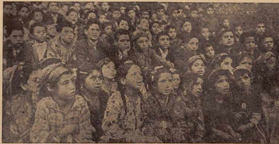
Naša slika prikazuje najmlajše učence v začetnih razredih, ki so najštevilnejši. Kot vidimo, sedijo na zemlji na podnožju hrička, v katerega so stopničasto, kakor v amfiteatru, izkopani sedeži, da bi lahko bolje videli šolsko tablo. Ker se otroci, sedeč na zemlji, pogosto utrudijo, so učitelji prisiljeni, da od časa do časa prekinejo učne ure. Abecedo se učijo na ta način, da izgovarjajo na glas črke, napisane na tabli. Med temi otroci je največje število onih, katerih starši so padli na fronti ali pa so umrli v francoskih taboriščih.

ske bolnišnice, v katerih se zdravijo in okrevajo ranjeni in bolni borci, a tudi žene in otroci. V primeru lepega vremena in zatišja je na dnevnem redu — oddih.