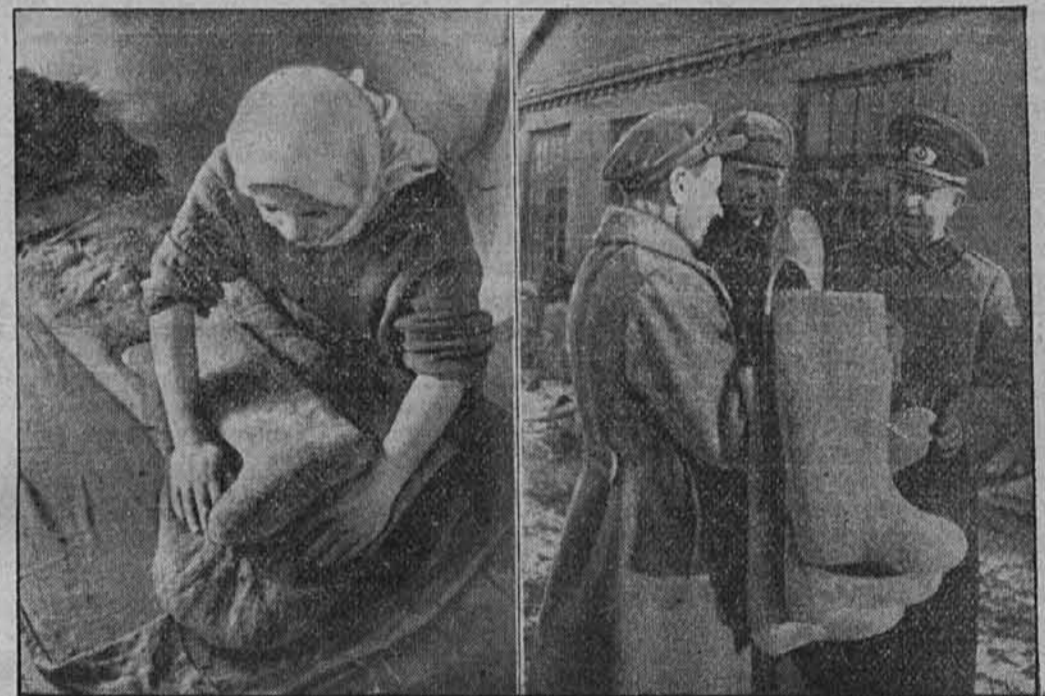
Škornji iz klobučevine za naše vojake