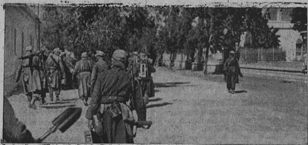
Nemške čete v zopet zasedeni Agedabiji Pešadija nemškega afriškega kora koraka v zopet zavzeto mesto.

V rokavskem prelivu je nek zaporni lomelec po kratki bitki s sovražnimi brzimi čolni dosegel zadetke. Verjetno je, da se je potopil en britanski čoln.