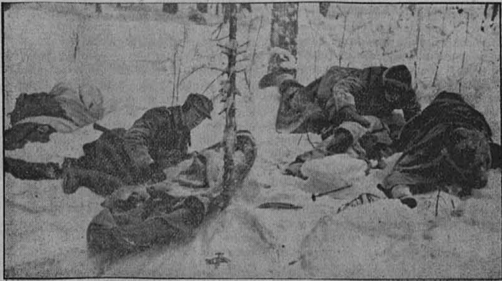
Prva pomoč v bojni coni