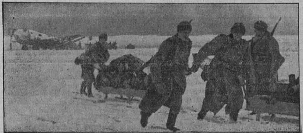
Letalo »JU« je prineslo tople zimske reči za fronto. Vojaki jih odvažajo na saneh v sprednje črte.

Posnetek iz bojev na vzhodni fronti, kjer morajo bolševiki dnevno utrpeti nove težke izgube. Razstreljeni oklopniki leže ob cesti, po kateri zasledujejo naše čete sovražnika.