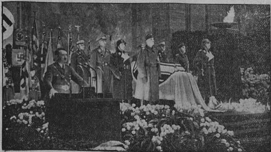
Führer se je poslovil od dr. Todta

Mislili bi lahko — in seveda misli tako sovražno inozemstvo že davno kakor povsod, kjer je videz kake pogrške nemškega vodstva —, da je nastala tukaj neka motnja v nemški propagandi. V resnici še nikoli ni bilo tega, da bi kdo strašen socialni in gospodarski položaj kakšne ogromne dežele navajal v isti sapi z njnimi bogastvi in njenimi neslutnimi možnostmi v