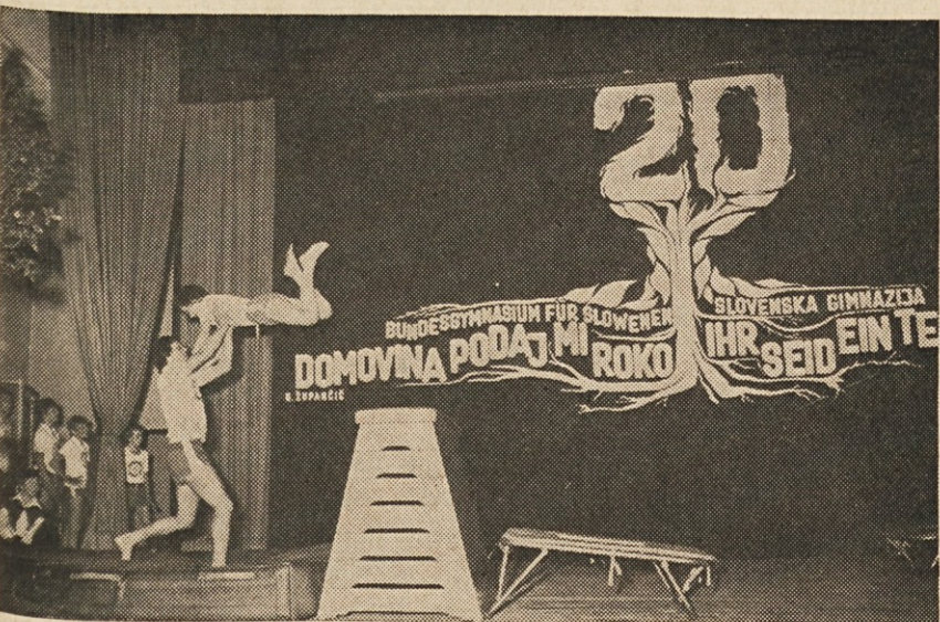
Telovadba: plavalni skok čez skrinjo