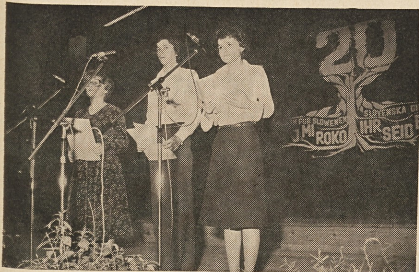
Recitatorji v svojem elementu