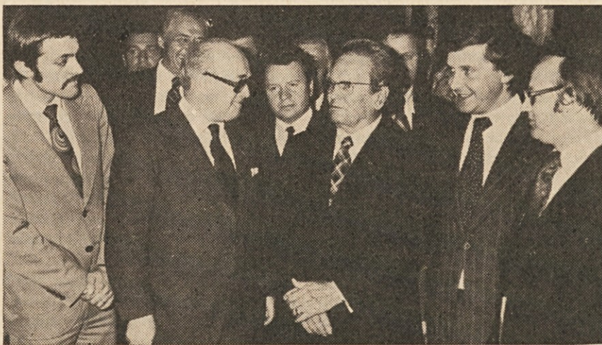
Slika kaže Tita v pogovoru s predstavniki koroških Slovencev.

goslavija. Da je ta dvojna svoboda tudi uspela, je največji del zasluga enega samega človeka, ene same osebnosti. Danes vsak pozna njegovo ime — ne le v Jugoslaviji, ampak po celem svetu. Josip Broz Tito ni le predsednik SFR Jugoslavije in predsednik KPJ, ampak tudi najbolj priznani voditelj gibanja držav, ki ga je sam bistveno oblikoval in ki imajo danes neprecenljivo težo — to so nevrščeni.