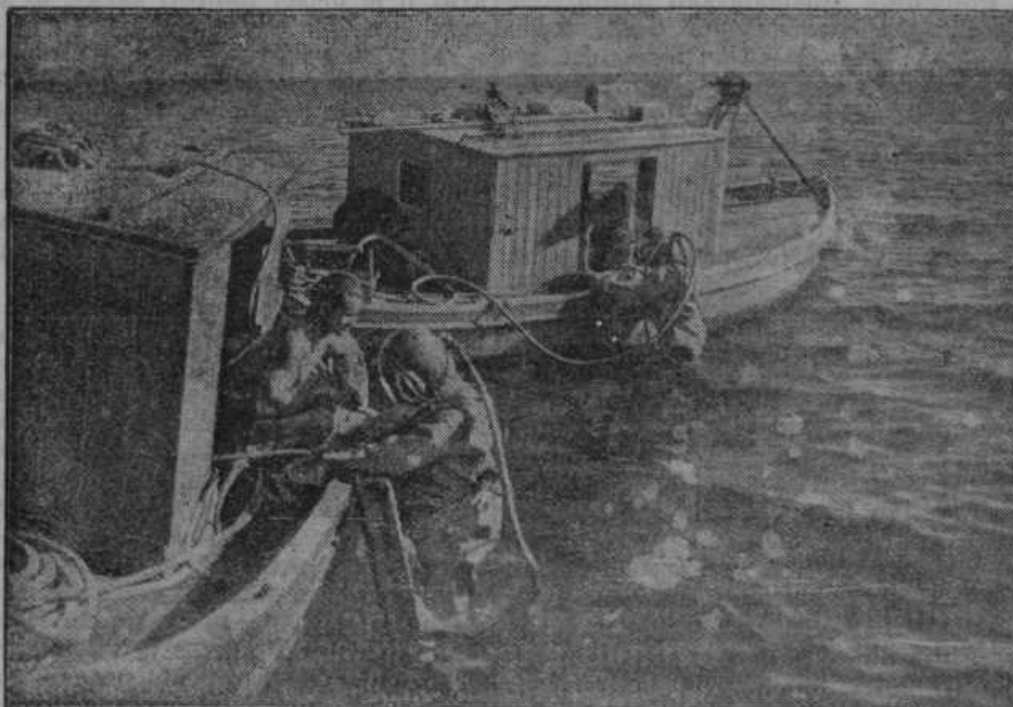
Fotografiranje merskih živali na dnu Adrije.