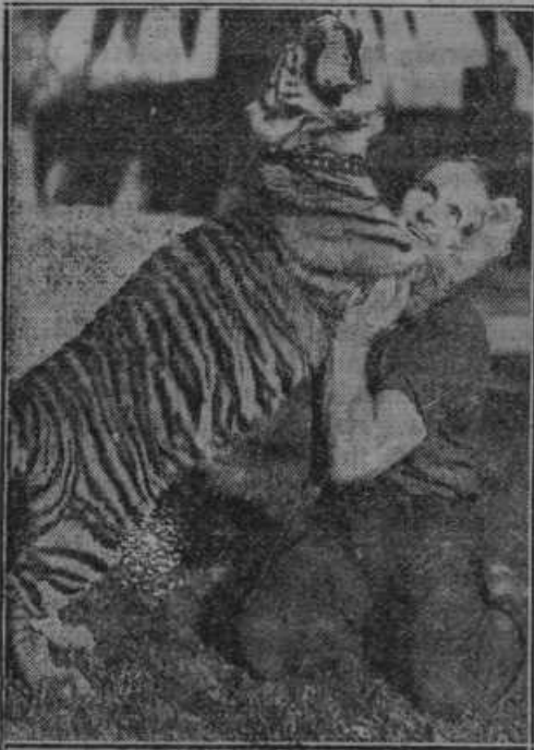
Enoleini tiger »satana« v kaliforniškem živalskem vrtu.

Največja rudniška nesreča v naši državi se je zgodila v soboto dne 21. aprila ob pol dveh vsled eksplozije plinov v premogovniku Kakanj blizu Visokega v Bosni. V rudniku je zaposlenih 1000 rudarjev, ki so po večini Slovenci in Zagorci ter delajo v treh šitih. Ob času eksplozije plina je bilo v rovu 222 rudarjev. Dosedaj so potegnili reševalci 52 trupel, usoda 78 rudarjev je neznan, rešilo se jih je 91. Reševalno delo je zelo otežkočeno, ker je silovitost eks-