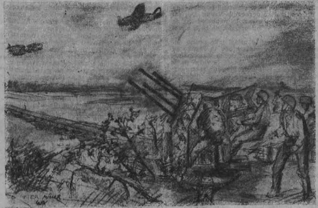
Obramba pred sovjetskimi bojnimi letalci pri nekem mostu. (PK-Zeichnung: Standarte »Kurt Eggers«, M.)