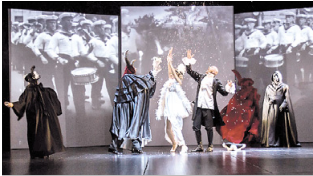
Prizor iz predstave

Predstava govori o raznoterih temah, ki se živo odražajo v značaju Gorice