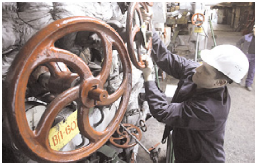
Gazprom je junija zaradi neporavnanih dolgov ustavil dobavo plina Ukrajini

Moskva je sicer lani, potem ko je tedanji ukrajinski predsednik Viktor Janukovič zavrnil podpis sporazuma z EU, znižala ceno plina s 485,5 dolarja na 268,5 dolarja, a jo je nato po pre-