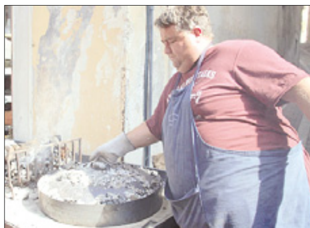
Peka pod žerjavico v Raštelu