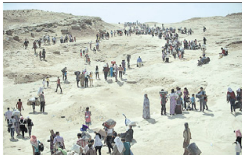
Sirci na begu iz svoje domovine