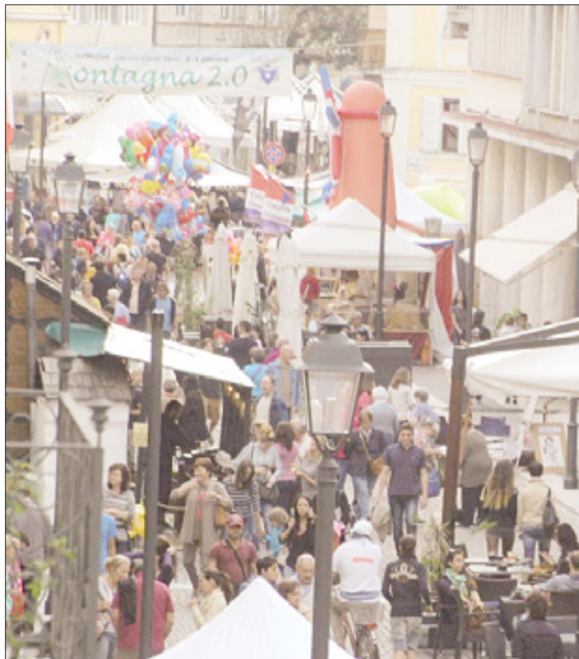
Popoldanski vrvež na Korzu Verdi