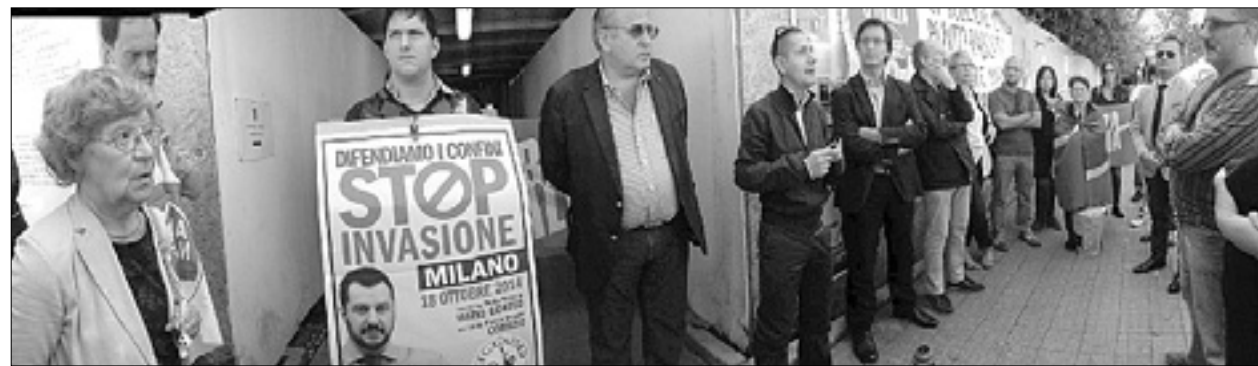
Desnosredinski shod pred pokrajino

V Ulici Brass ostalo 44 priseljencev, kmalu naj bi bil tabor izpraznjen - Današnji shod skrajne desnice bo potekal na Placuti