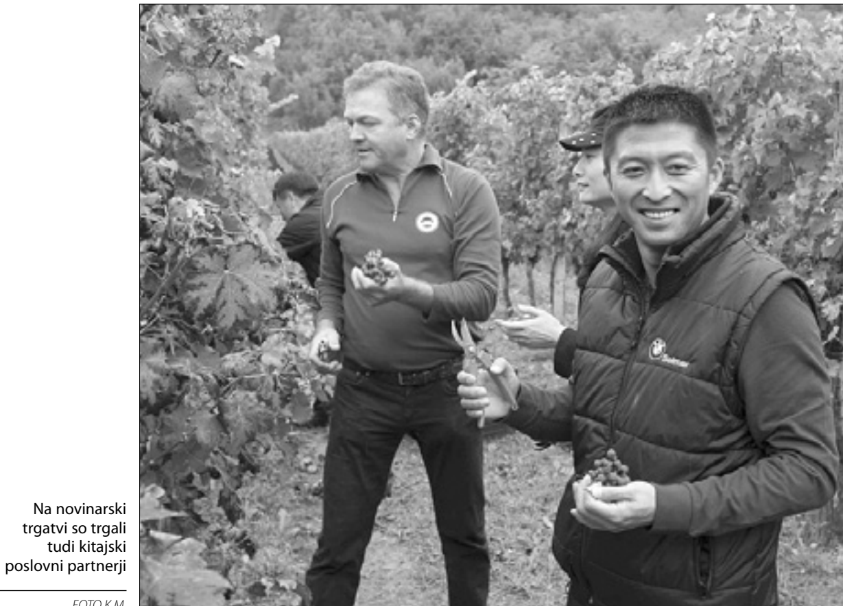
Na novinarski trgatevi so trgali tudi kitajski poslovni partnerji

Poslovni partnerji z Daljnega vzhoda v živo spoznali nastajanje briškega vina