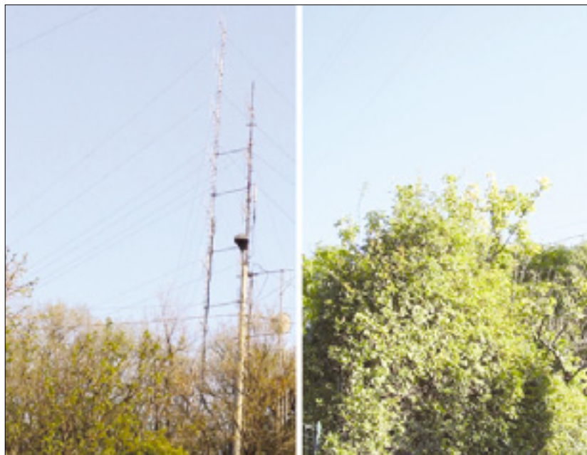
Tam, kjer je bil pretvornik, so zdaj samo drevesa