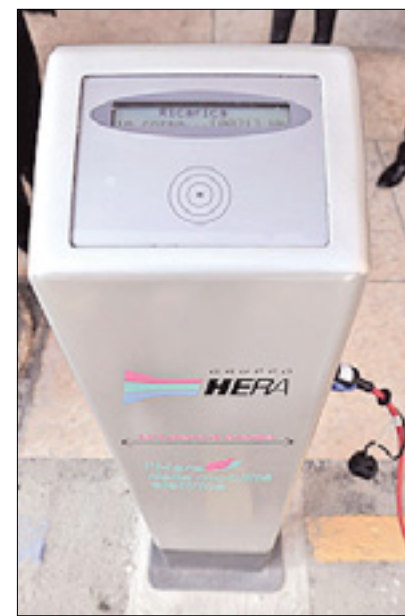
Postaja za električna vozila