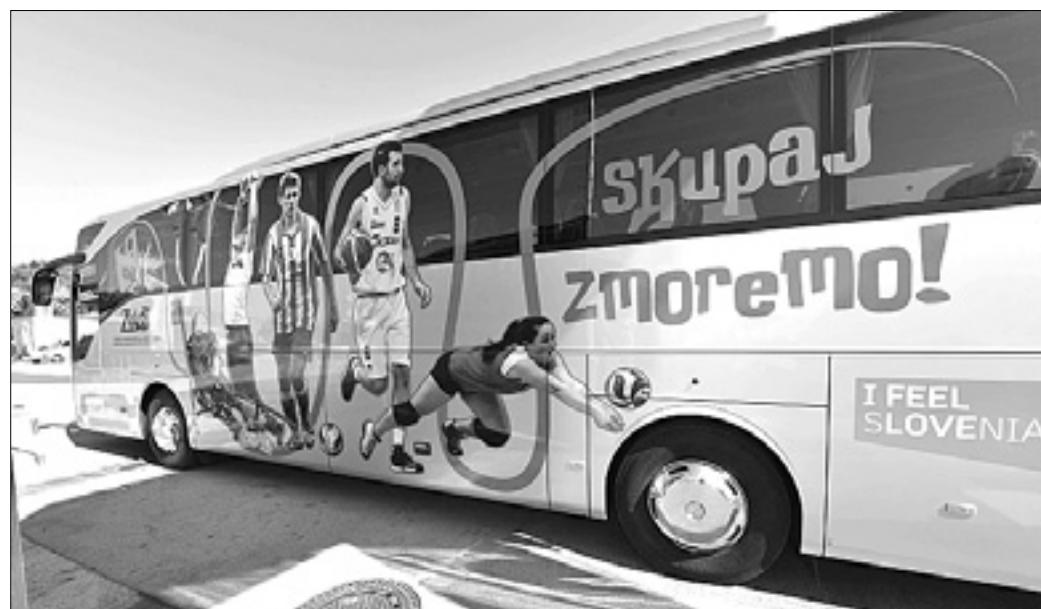
Zamejski športni avtobus so predstavili v portoroški marini