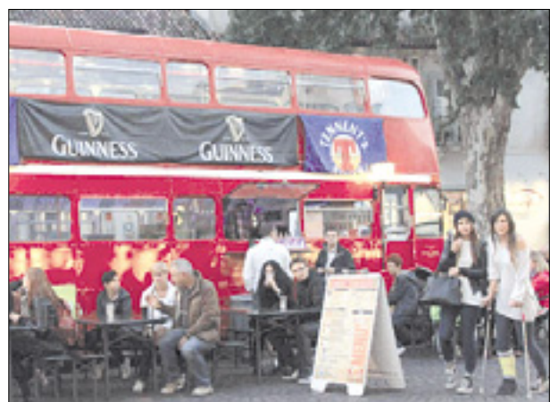
Angleški avtobus na Trgu Sv. Antona