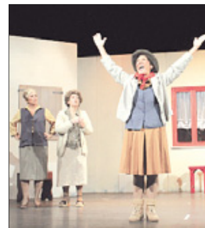
S predstave v Kulturnem domu

Seveda zahteva prisotnost na goriškem prazniku tudi veliko dela. »Od začetka tedna je bilo za postavljanje šotora in stojnic dnevno prisotnih od trideset do petdeset ljudi,« pojasnjuje Padovanova in poudarja, da se bo ravno toliko ljudi - mogoče tudi še več - zvrstilo za stojnicami tudi med samim praznikom.