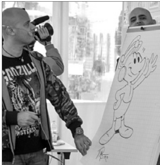
Na levi delavnica Topolino, na desni otroci med znanstvenim poskusom

Pri stojnici OGS tudi bioreaktor za pridobivanje biodizla, izdelek lanskih petošolcev zavoda Stefan