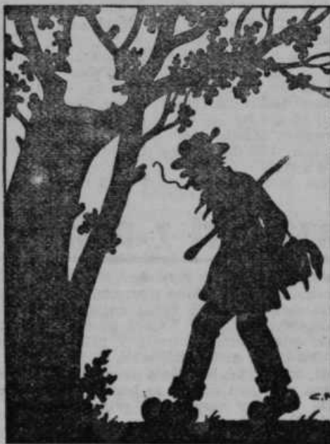
Kjo je gosdar?

last, smete z njo svobodno razpolagati, ker si je skoro gotovo oče pridržal gospodarstvo le z ono živino, katero Vam je izročil, odnosno bi bilo pogodbo tako razlagati.