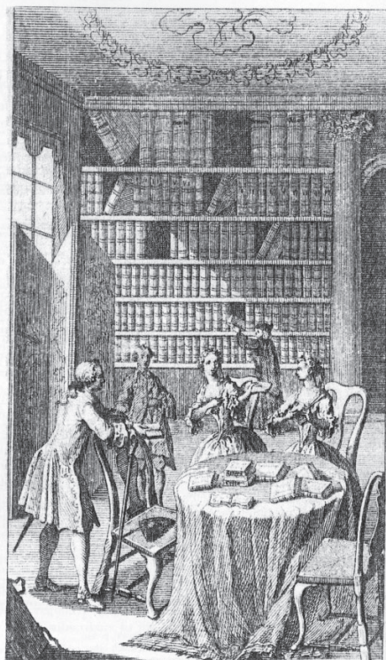
Plate 11 Engraving of Thomas Wright's Circulating Library, Exeter Court, off the Strand, mid-1700s. Oxford, Bodleian Library, Douce Portfolio 139, no. 303

Izposojevalna knjižnica seveda ni prvi tip knjižnice, ki funkcionira tudi kot družabni center. Že aleksandrijska knjižnica, Museum , je med drugim