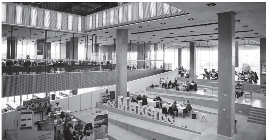
Slika 8: Kreativnica ( makerspace ) v knjižnici in kulturnem centru v Aarhusu na Danskem, 2015

Matternova navaja vrsto primerov iz ZDA, ki po mnenju nekaterih sodobno javno knjižnico kažejo v vlogi demokratizatorja podjetništva, podpornika zagonskih podjetij oz. ponudnika lastne odprtokodne tehnologije in neodvisnih medijev. 67 Ne gre le za to, da tovrstna ponudba praviloma pomeni vstop komercialnih ponudnikov in podjetij v knjižnične prostore in jemlje prostor tihim conam. »Spodbujanje in navdušenje nad takimi projekti se spogleduje z neoliberalnimi vrednotami.« 68 Utelesa logiko unovčljivih rešitev, gonjo za učinkovitost in inovacijo in promovira idejo, da je »narediti nekaj novega« enako kot »ustvariti novo znanje«, kar je lahko nevarna zmota. Ampak, »kakšno znanje dobimo, ko na 3D tiskalniku natisnemo obesek za ključel?«, se retorično sprašuje Matternova. 69