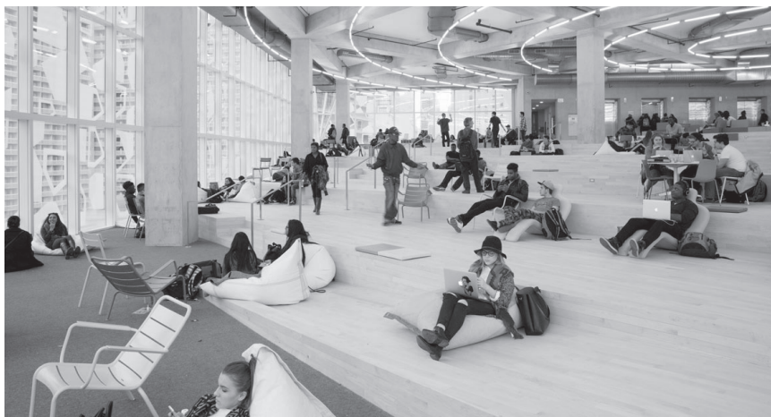
Slika 6: Študijski center Ryerson, Toronto, Kanada, 2015

komentar, da današnje knjižnice sploh niso videti kot knjižnice, moramo zato brati predvsem v luči odmika od tradicionalnega, na knjigo osrediščenega interierja, pa tudi v luči precej svobodne arhitekture. Večina novozgrajenih sodobnih javnih knjižnic se centralno odpira v več nadstropij, ki jih povezujejo dvigala in tekoče stopnice, in so grajene okrog atrija, kar omogoča kar največ naravne svetlobe. Površine so svetle, veliko je stekla oz. oken do tal in vhod stoji na ravni ulice, da olajša pretok ljudi (Slika 7). 22