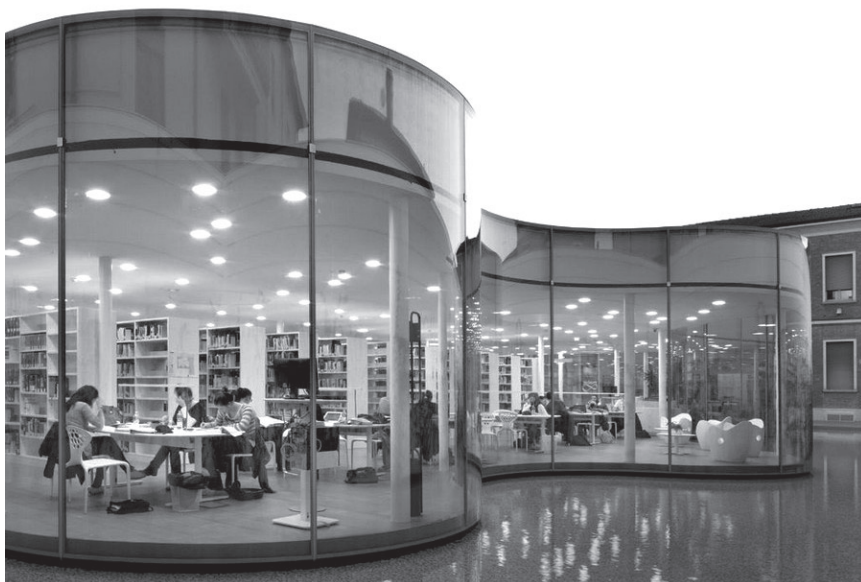
Slika 7: Knjižnica v Maranello v severni Italiji, 2011