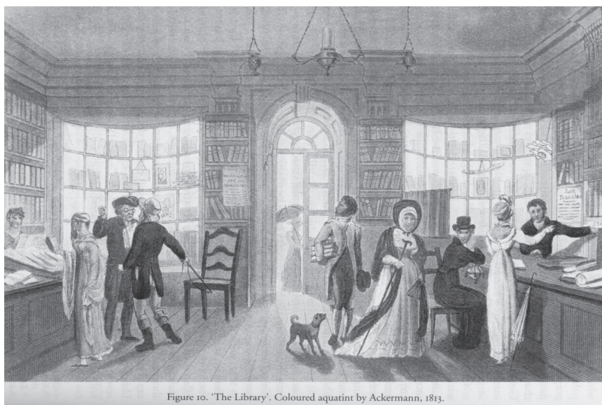
Figure 10. 'The Library'. Coloured aquatint by Ackermann, 1813.

Mnoge izposojevalne knjižnice so bile zato prostorsko organizirane kot (nekakšne) trgovine, kjer so stranke prodajalcu za pultom naročale želene artikle – od knjig, ki so si jih želele izposoditi in so jih izbrale preko kataloga, pa do sirupa in tablet (Slika 4). V izposojevalnih knjižnicah 18. stoletja knjige praviloma niso bile prosto dostopne; ponekod so bile obiskovalcem praktično skrite; drugje so se lahko sprehajali med policami, a gradivo so smeli izbrati le ob spremstvu uslužbenca. Vendar pa to ni v ničemer oviralo intenzivne izrabe teh prostorov v raznotere, predvsem družabne namene. Mnoge so izkoristile potencial klientele, ki jo je tja privabljala heterogena ponudba, in so svoj repertoar storitev obogatile še s ponudbo družabnega programa in prostorov za druženje, npr. čitalnic za prebiranje periodike, kjer so ponekod postregli tudi s kavo, čajem in prigrizki (Slika 5). Če ne drugega, so se obiskovalci družili v osrednjem prostoru, ob pultu in policah.