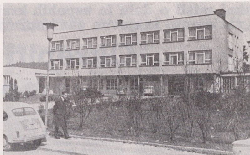
Zdravstveni dom Vič

Kar pa zadeva vaše vprašanje glede skrbi gospodarskih organizacij za zdravstveno varstvo delavcev, moram le-te brez dvoma pohvaliti tako glede razumevanja, ki ga imajo za zdravstvo kot glede števila takojimenovanih prednostnih ordinacij za svoje delavce. V občini skoraj ni večjega podjetja, ki še ne bi imelo svojega pooblaščenega zdravnika, ali ki se ne bi najintenzivnejše pripravljalo na to, da ga dobi. To je vsekakor pohvalno, posebno še zaradi tega, ker imam občutek, da prihaja v delovne kolektive vse bolj zavest, da je lahko le zdrav proizvajalec dober proizvajalec. Glede preprečevanja nesreč pri delu smo precej napredovali z nastavitvami tako imenovanih varnostnih tehnikov oz. inženirjev v podjetju. Na žalost pa kljub temu, da vemo, da botruje alkohol velikemu odstotku nesreč pri delu, nismo uspeli, da bi se bifeji in male pivnice zjutraj odpirale šele potem, ko bi bili delavci že na delu.