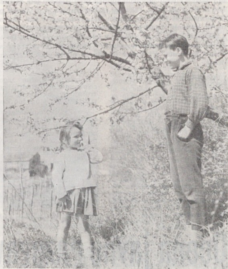
ZIVEL 1. MAJ!