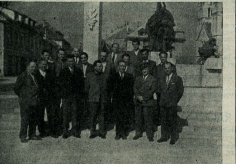
Člani upravnega odbora AMD Kočevje