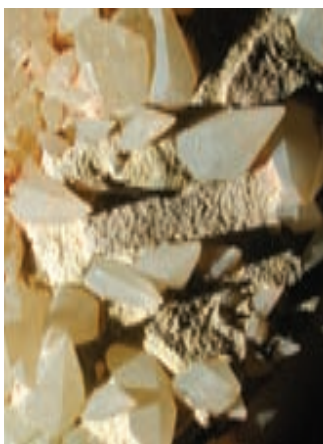
Skalenoeederski kristali kalcita; izrez 35 x 25 mm. Najdba in zbirka Cveta Gašpirca.