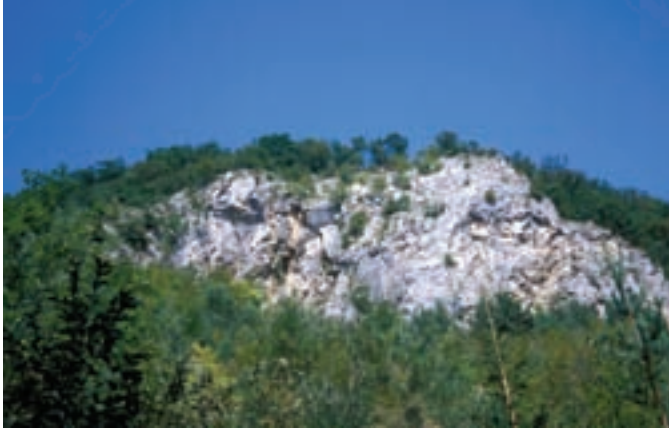
Pogled na neoschwagerinske apnence, v katerih lahko najdemo lepe skalenoodre kalcita.

Na Mlinem ob Blejskem jezeru zavijemo južno proti vasi Selo pri Bledu. Pred vasjo se severozahodno od ceste dviguje greben Straže (642 m), ki ga gradijo drobnozrnati masivni dolomiti anizijske starosti. Enako zgradbo ima tudi greben Dobre gore