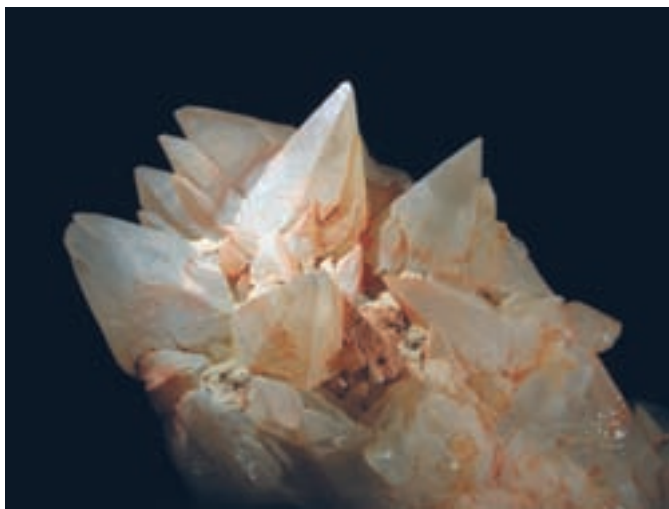
Skupek skalenoeedrskih kristalov kalcita; 86 x 57 mm. Najdba in zbirka Cveta Gašpirca.

(620 m), ki leži jugovzhodno od Straže. Med dolomiti pa ob prelomih v smeri zahod severozahod-vzhod jugovzhod izdanjajo grebenski neoschwagerinski apnenci in breče srednjeperske starosti, ki gradijo vrh Straže.