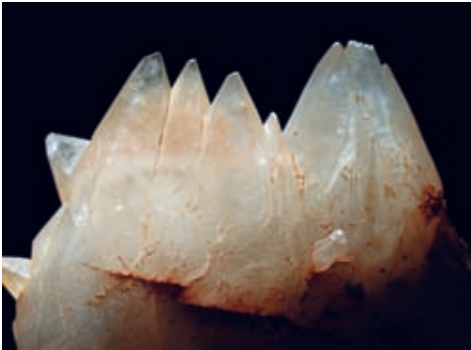
Kalcit s skalenoedrskim habitusom; 64 x 53 mm. Najdba in zbirka Cveta Gašpirca.

Na Mlinem ob Blejskem jezeru zavijemo južno proti vasi Selo pri Bledu. Pred vasjo se severozahodno od ceste dviguje greben Straže (642 m), ki ga gradijo drobnozrnati masivni dolomiti anizijske starosti. Enako zgradbo ima tudi greben Dobre gore