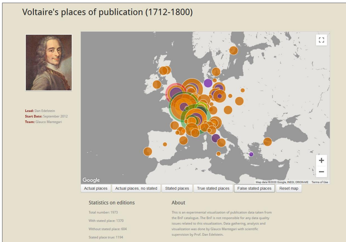
Slika 4: Vizualizacija krajev izida Voltairovih del, ki jih hrani Francoska nacionalna knjižnica, v obdobju med 1712 in 1800 s filtri za: dejanske kraje izida, kraje izida, ki niso navedeni, pa so bili ugotovljeni iz drugih virov, kraje izida, ki so navedeni, kraje izida, ki so navedeni in so tudi dejanski kraji izida, ter namenoma napačno navedene kraje izida

digitalnih zbirk ohranjenih pisem in drugih zapiskov ter objavljenih del, ki jih hranijo različne dediščinske ustanove na čelu s knjižnicami. Podatki o osebnih in drugih stikih posameznih oseb, zbranih z uporabo aplikacij in orodij za vizualizacijo različnih družbenih fenomenov, omogočajo tudi njihove statistične, kronološke in prostorske analize ter prikaze (sliki 3 in 4).