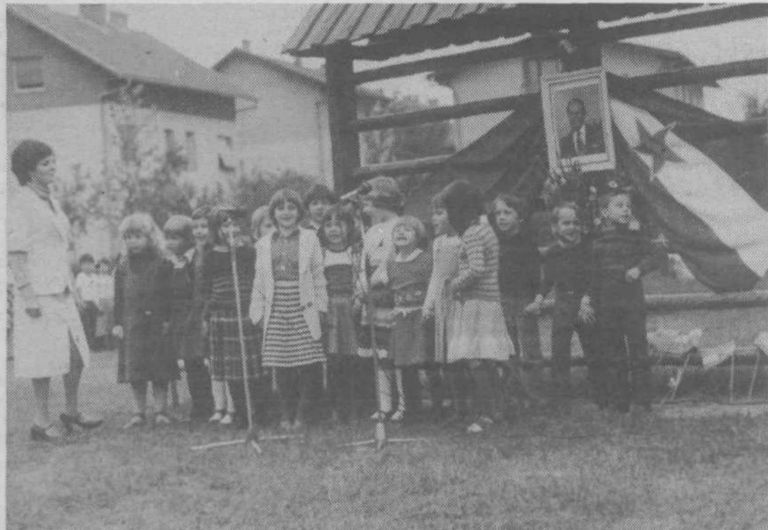
Otroci, ki so v varstvu, so srečni in zato imajo za Tita in za starše vedno najlepše, kar premorejo (VVZ Kekec v Novih Jaršah)

projektu predvidena možnost dozidave štirih učilnic. Zaradi nujnih prostorskih potreb bo na zahtevo gradbenega odbora ena učilnica povečana za kabinet in opremljena kot učilnica za fiziko. Učilnica na že dograjeni osnovni šoli namreč niti v najmanjši meri ne omogoča sodobnega kabinetskega pouka, saj so v njej sedaj kar štiri predmeti: fizika, biologija, gospodinjstvo in kemija, kar je pri tako velikem številu učencev in oddelkov popolnoma nemogoče. V prizidku bodo še trije kabine in večnamenske komunikacije, t.j. predprostor pri učilnicah, ki se ga bo dalo zložljivo steno združiti oz. ločiti od ene od učilnic. V kleti bo zaklonišče za 200 oseb. Čiste površine bo 618 kv.m, z zidovi pa 712 kv.m. Ocena stroškov izhaja iz izhodišč, dogovorjenih pri oceni stroškov za objekte iz II. samoprispevka, in znaša 7.686.684 din. Pričetek del je predviden letos v oktobru. Izvršni odbor je predlagane programske osnove potrdil.