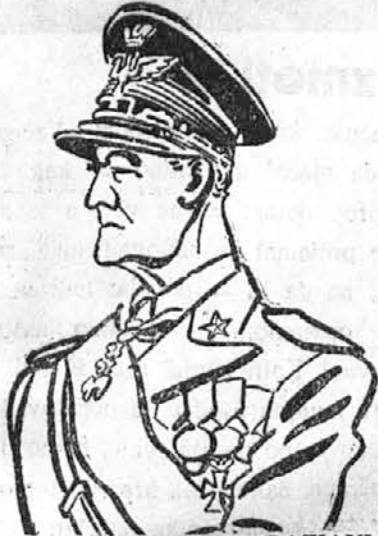
Maršal RODOLFO GRAZIANI novi poveljnik italijanskih oboroženih sil v Libiji

Delnice Sueškega prekopa predstavljajo za lastnike ogromen vir dohodkov. Društvo deli dividende, ki dosežejo včasih 200%. Veliki dobički lastnikov delnic izvirajo od tranzitnih taks, ki se plačujejo za prevoze skozi kanal. V poslednjih letih so bile te takse na zahtevo mednarodnih pomorskih društev precej znižane, a so v kljub temu še vedno visoke. Taksa je znašala v februarju 1939 za eno tona okoli 6 angleških šilingov, približno toliko tudi za potnike.