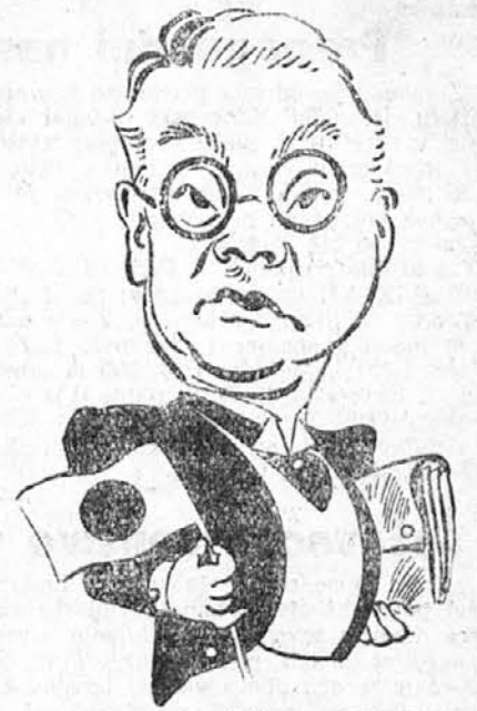
Zunanji minister ARITA napoveduje odločno akcijo Japonske za ustvaritev nove Azije na Daljnem vzhodu

Odkod izraz »peta kolona«? Prišel je iz španske državljanske vojne. V Madridu je bilo precej pristašev generala Franca in ko so njegove čete v štirih kolonah napredovale proti mestu, je general Molla dejal: Peta kolona bo zavzela Madrid. Misli je na one pristaše nacionaliste, ki so bili v obleganem mestu.