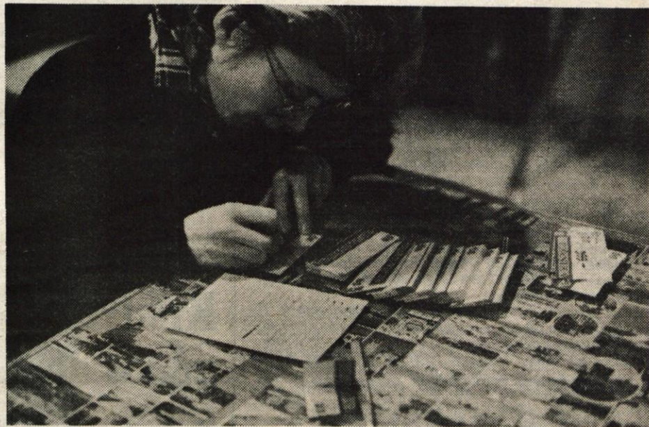
Novi časi, novi običaji, bi lahko rekli za prve dni novega leta. V trgovinah so se pojavile cene v novih konvertibilnih dinarjih, ki so zmedle potrošnike. V bankah so ljudje prvega dne še zamažali na nov denar, z legalno menjavo deviz so sramežljivo začeli popoldne. Naftni monopolist Petrol je z novim letom ukinitel poslovanje s čeki. V trgovinah se vrste inventure, kjer novim cenam ne odpisujejo le ničel, pač pa jim doračunavajo tudi novi davek za JLA.