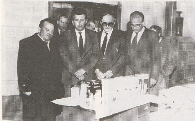
Delegacija Gospodarske zbornice SAP Kosovo v Gorenju Mali gospodinjski aparati Nazarje