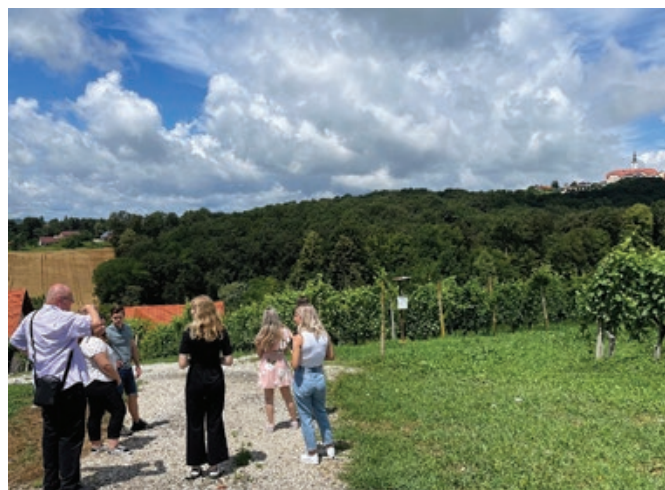
Terenski ogled študentov z mentorjem na območju Občine Destrnik

Območja za izdelavo strokovnih rešitev in širitev območja so že opredeljena v OPN občine Destrnik, končno poročilo ne odstopa od strateških usmeritev prostorskega načrtovanja v občini, za nadaljevanje prostorskega razvoja pa ponuja odločitve na nivoju strokovnih podlag za širitev ureditvenega območja naselja.