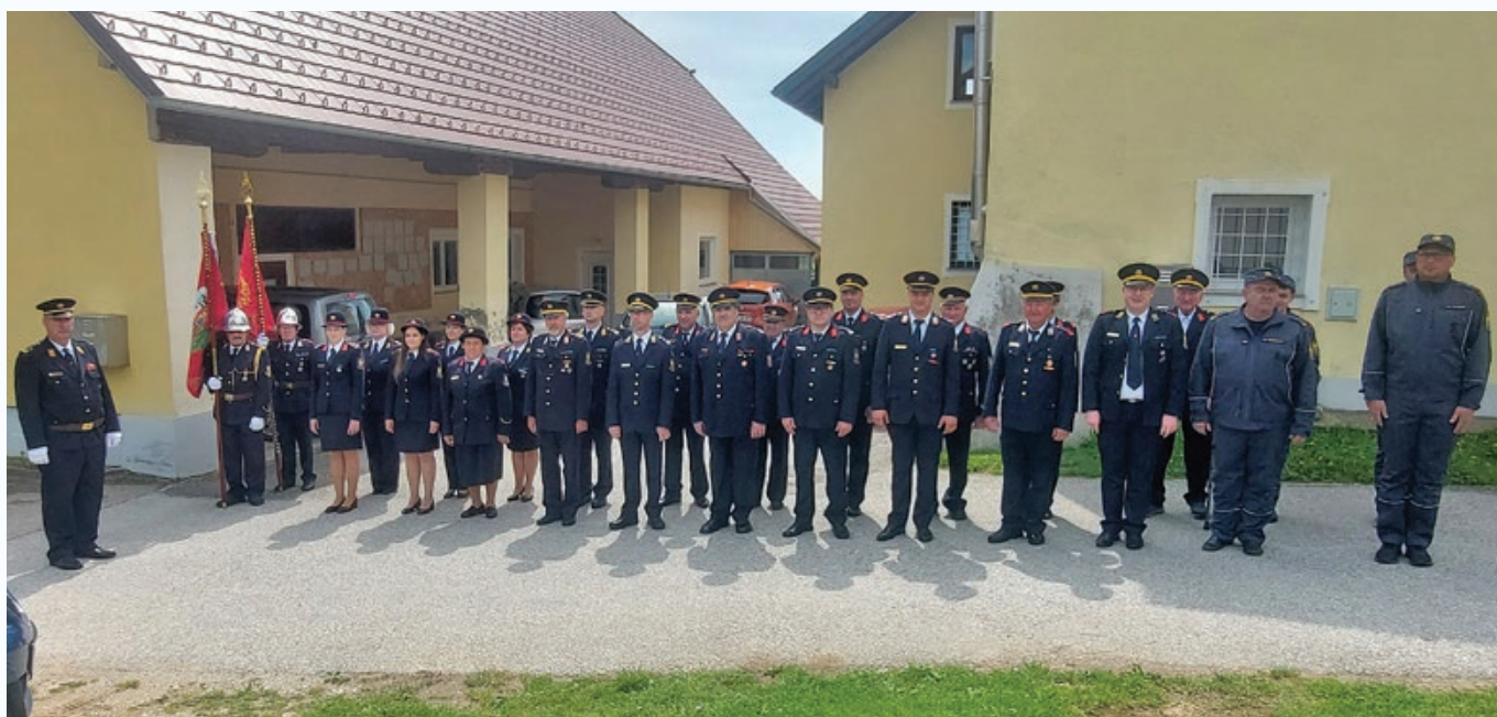
Florijanova maša v farni cerkvi sv. Urbana za gasilce GZ Destrnik