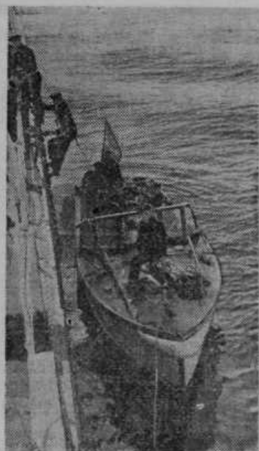
Nemci se podajo na zaustavljeni parnik v Severnem morju, da preišče njegov tovar