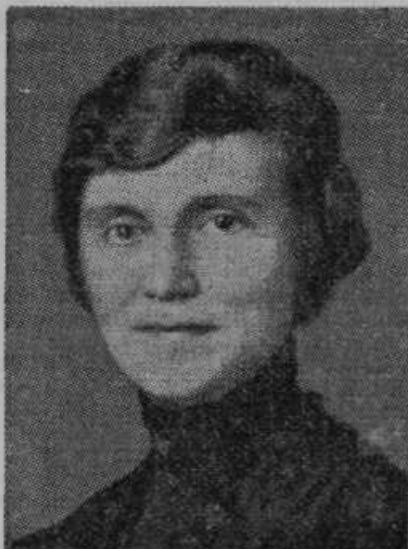
Bivša avstro-ogrška cesarica Zita, o kateri potrjujejo vesti, da bo postal njen sin Oton vladar po tej vojni na novo vzpostavljene Avstrije

Kaj čakate? Ali hočete zopet naročiti cenik šele potem, ko bo istega zmanjkalo. Pišite še danes trgovski hiši Stermecki, Celje po novi cenik in vzorce. 1573