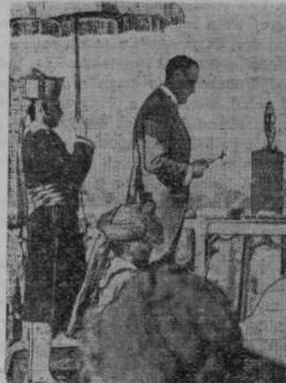
Indijski podkralj, angleški lord Linlithgore, govori indijskim voditeljem, kateri zahtevajo, da postane Indija angleški dominijon po zgledu Avstralijske, Kanade itd.