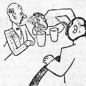
— Je že res, da je hudo zate prijatelj! Toda solze prelivaj v svoj kozarec...

Na Slovaškem izhaja sedem dnevnikov, 4 slovaški, 1 nemški in 2 madžarska. Službeni vladni organ je »Slovak«.