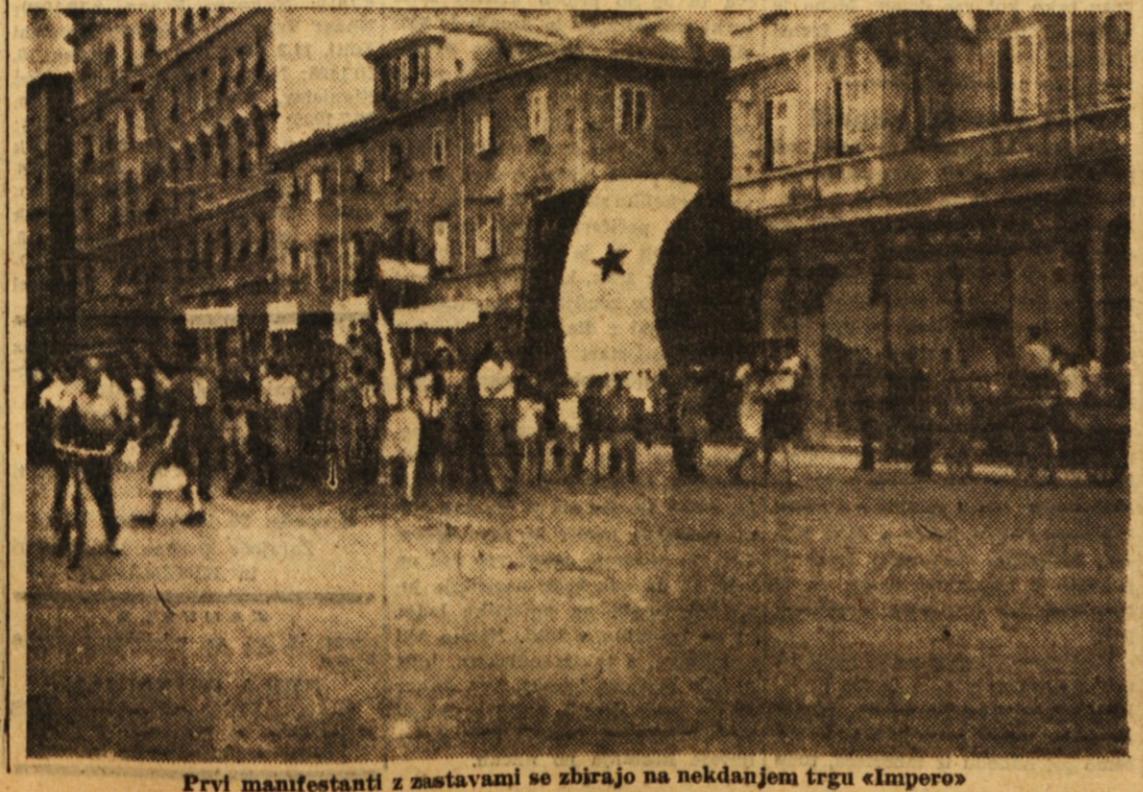
Prvi manifestanti z zastavami se zbirajo na nekdanjem trgu «Impero»