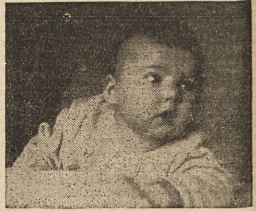
Kaj je treba pripraviti pred porodom?

Predvsem je treba pripraviti svojo duševnost. Upanje in veselje do zmage mora prevladati nad potrtostjo in strahom.