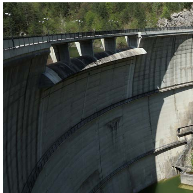
Ob umetnem jezeru Ciul je hidroelektrarna.

Končno sva le prišli do umetnega jezera Ciul, ki se razcepi na Canal Grande di Meduna in na Canal Piccolo. Ujeto med strmimi, večinoma z listavci poraščenimi bregovi okoliških vrhov, je samevalo v tišini.