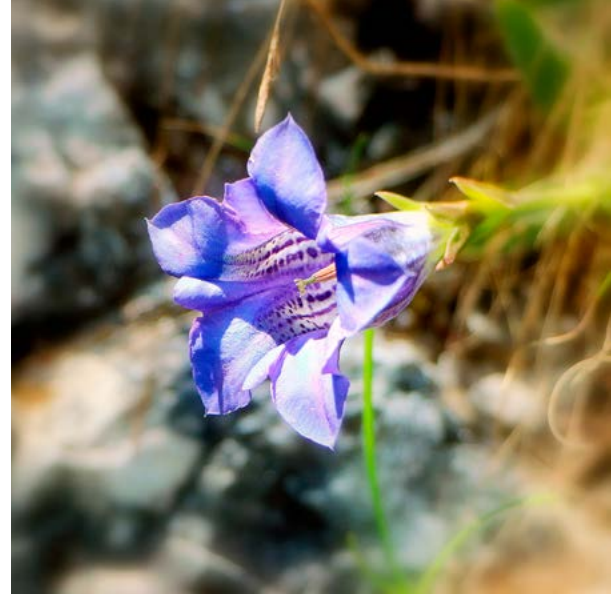
Na južnem pobočja Cime Zuviel je zacvetel Froelichov svišč.