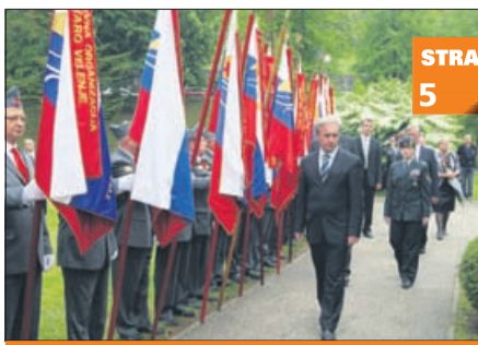
V Topolšici ob dnevu zmage