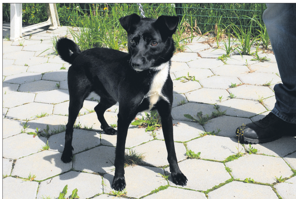
Maxa so prav tako kot Sara našli v Velenju, le da je star dve leti in manjše rasti.