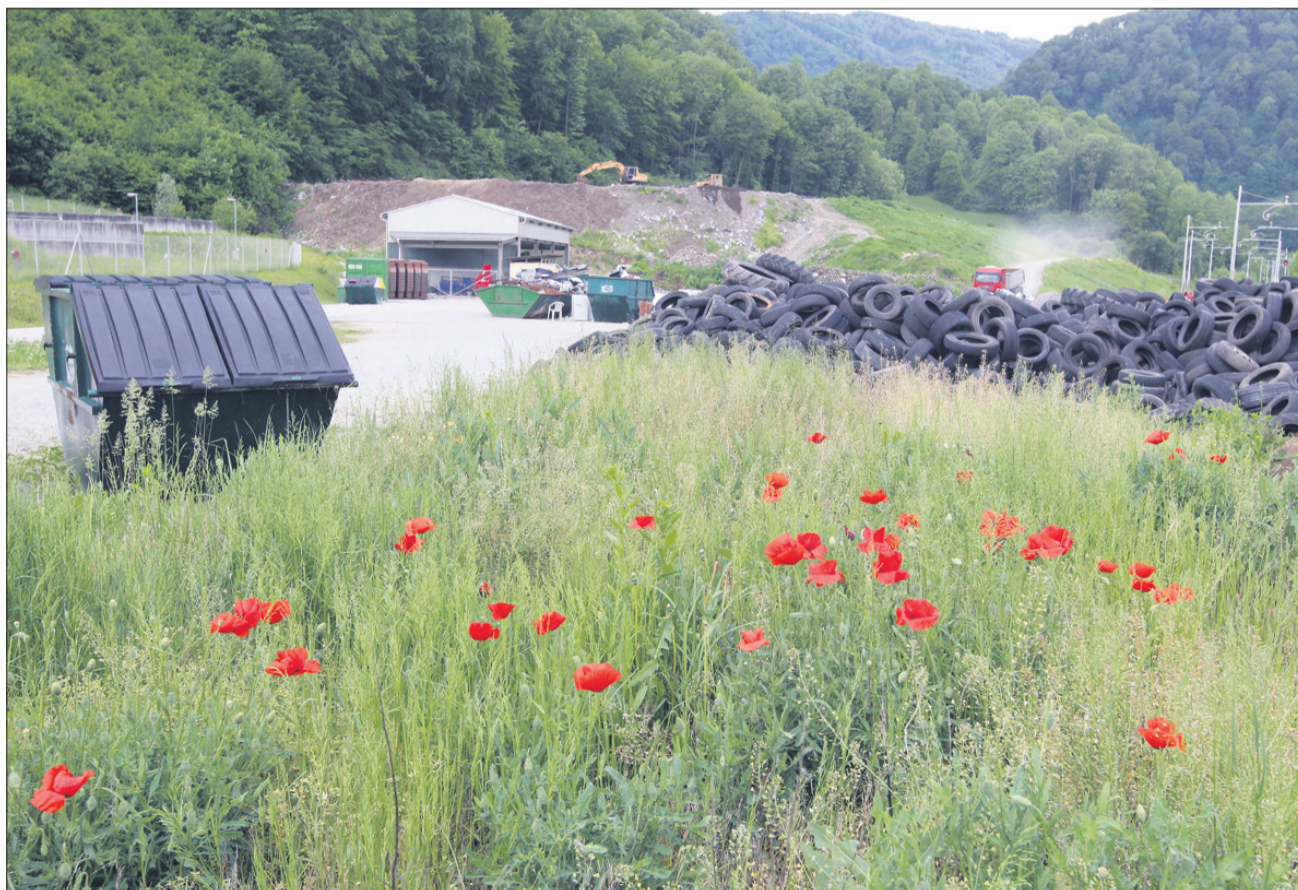
Narava na koncu vedno zmaga ...

Želite, da bi tudi bralci Novega tednika izvedeli več o vašem nepozabnem dogodku, ko ste izrekli usodni da? Pokličite nas na 4225-164 ali nam pišite na Novi tednik, Prešernova 19, 3000 Celje oziroma na elektronski naslov tednik@nt-rc.si .