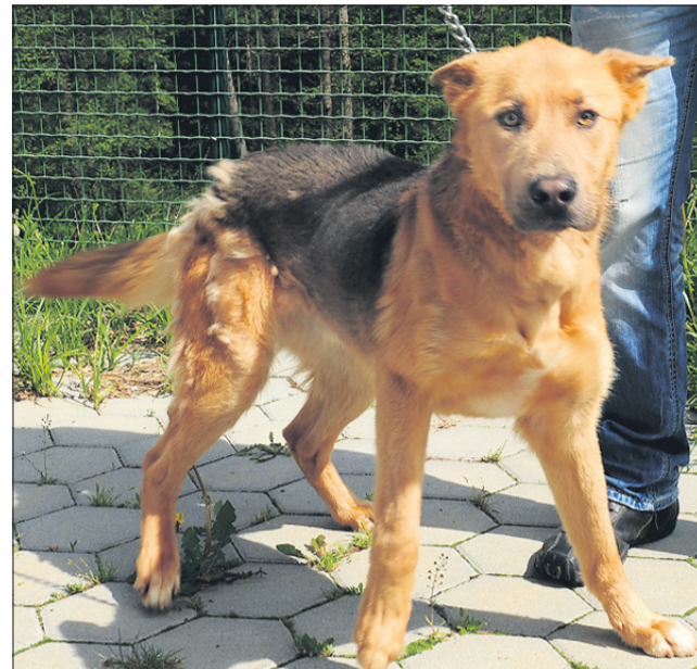
Uzi je star 10 mesecev. Prijaznega mešanca srednje rasti so našli v Žalcu.