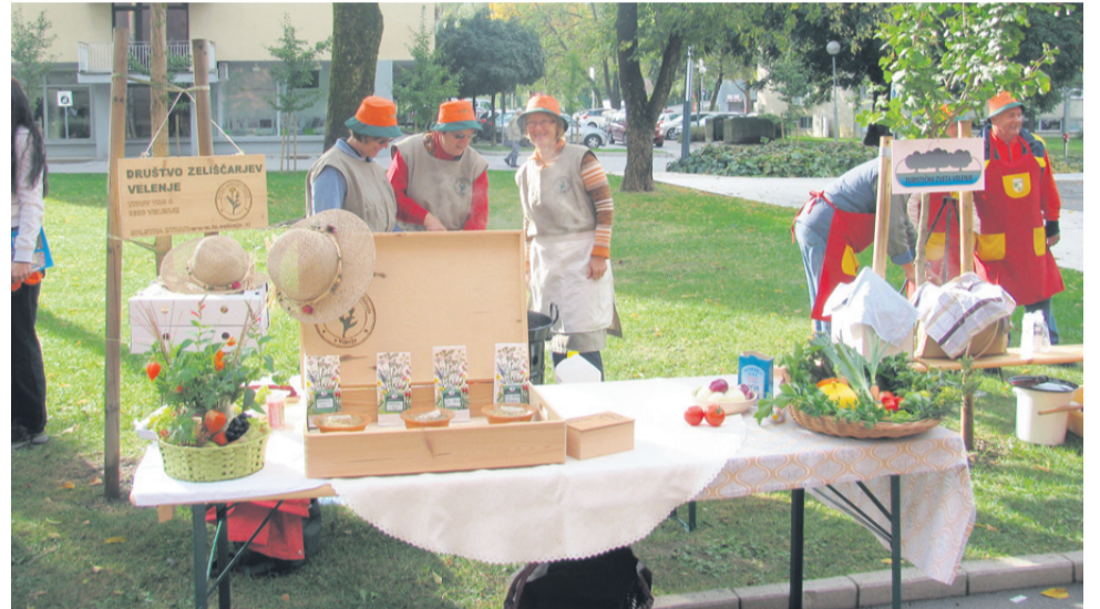
Stojnico Društva zeliščarjev Velenje domačini radi obiščejo.

Za en dan zamenjajte svoje šefe in poklic!