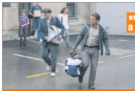
Pisker bo spet počil