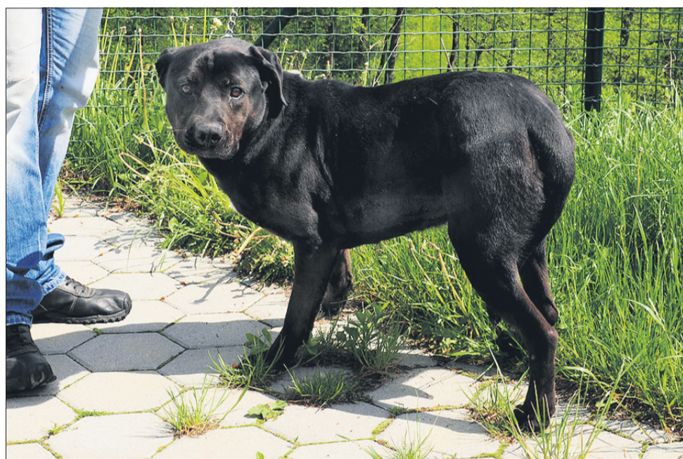
Viko je mešanec, star tri leta. Našli so ga Šentjurju. Je srednje rasti in prijazen.