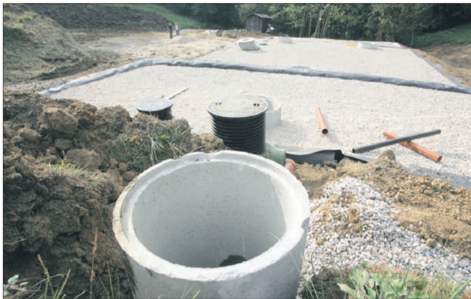
Biološko čistilno napravo gradijo tudi v Dobju.

Greznice, kot so jih delali naši očetje in dedki, so stvar preteklosti. V zakonodaji bodo dokončno prepovedane do leta 2017, kar je posledica zlasti njihove ekološke spornosti. Cena gradnje greznice je v začetni fazi res nižja kot cena gradnje ustrezne čistilne naprave, a odvoz vsebine greznic je strošek za celo življenje, ki se bo sčasoma le še povečeval. Tako na veljavi vse bolj pridobivajo domače čistilne naprave, iz katerih izteka čista voda, ki dosega zakonsko določene zahteve o čistosti vode. Posledično lahko to pomeni oprostitve plačila ekološke