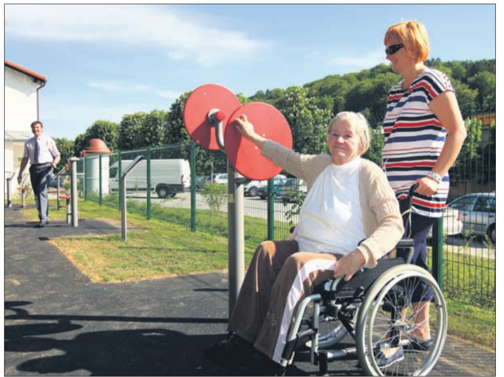
Naprave v fitnesu na prostem so prilagojene tudi invalidom na vozičku. Prav tako seveda dostop do fitnesa. Tako si je mogoče krepite mišice na rokah.

Fitnes je prilagojen za invalide, tudi tiste na vozičkih, s čimer občina Rogaška Slatina ponovno dokazuje, da je invalidom prijazna občina in da se kljub temu, da je listino Občina po meri invalidov pridobila že leta 2008, še naprej trudi dodajati nove vsebine in invalidom zagotoviti kakovo-