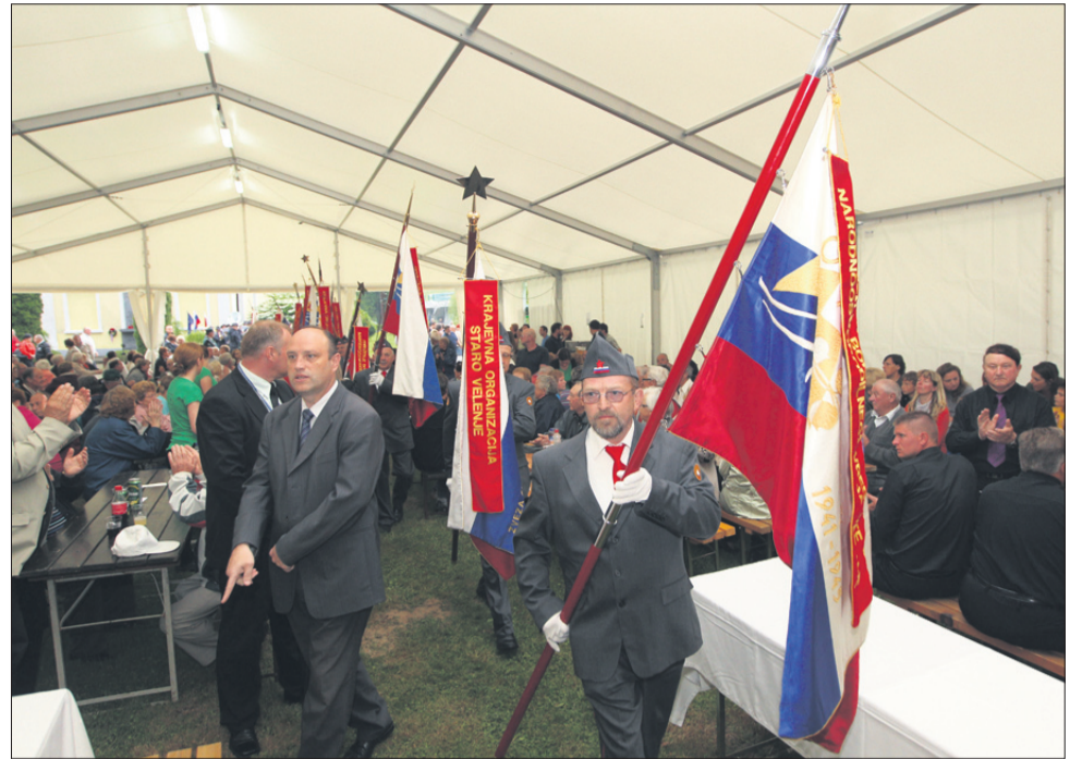
Tudi letos se je na proslavi v Topolšici zbralo veliko ljudi.

V petkovi številki Novega tednika bomo objavili daljši pogovor z ministrom Hojsom, ki se je na Topolšici dotaknil tudi varčevalnih ukrepov: »Nihče od vlade ne pripravlja varčevalnih ukrepov zato, da bo Sloveniji vladal nekdo drug. Ukrepi niso zato, da bi nekdo iz Bruslja povedal, kako moramo delati, temveč zato, da bomo Slovenci jutri živeli bolje.«