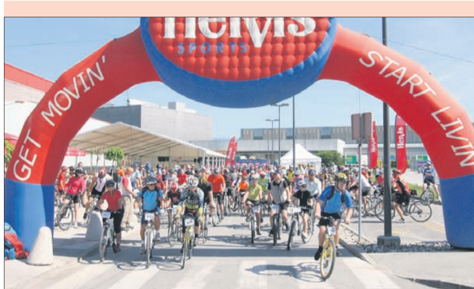
Lani je kolesarilo približno tisoč kolesarjev. Vsaj toliko jih pričakujejo tudi letos. Če bo vreme slabo, bodo prireditve prestavili na 27. maj oziroma 3. junij.