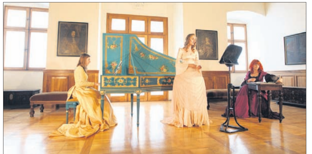
Baročna glasba je v dobrih izvedbah izvajalcev v baročnih kostumih pod Celjskim stropom izvenela še posebej prepričljivo.