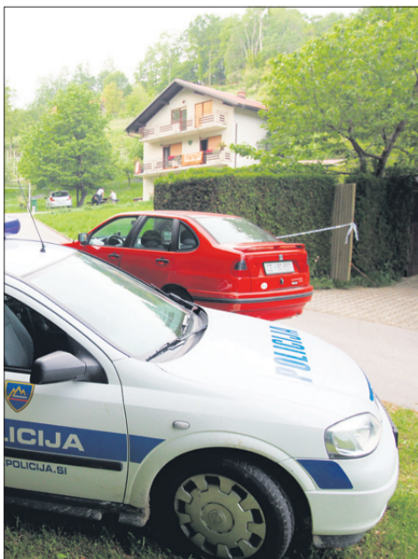
V tej hiši sta ugasnili življenja očeta in sina.