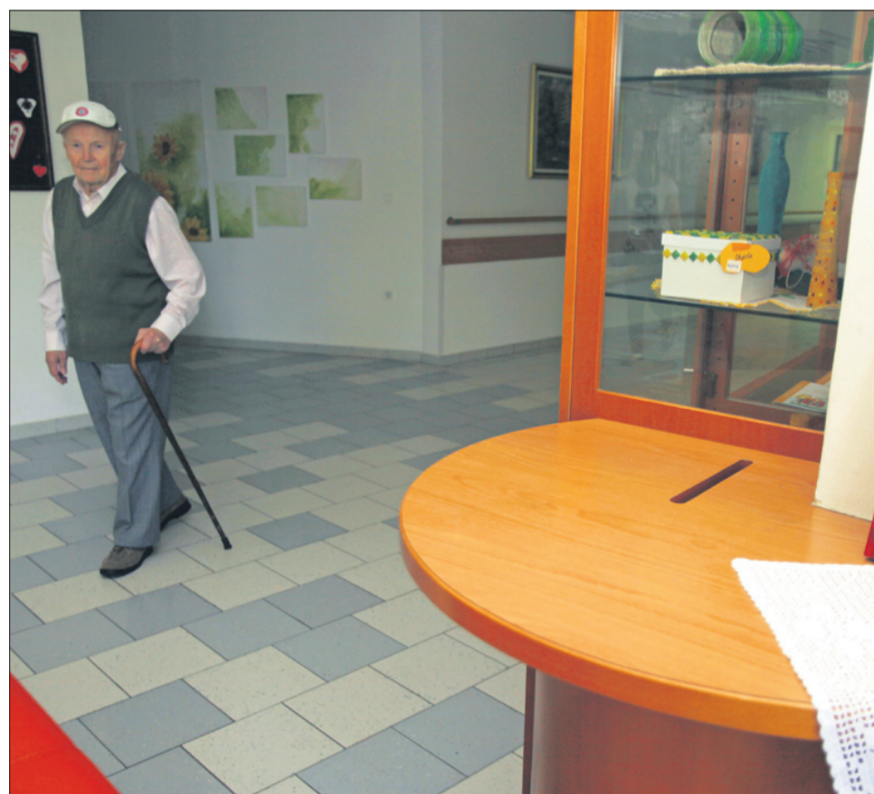
Skrinjica za Anonimko je tudi v Domu ob Savinji v Celju

Akcija zbiranja anonimnih zgodb in pričevanj se je že začela. V Centru za socialno delo, V Osrednji knjižnici Celje in v Domu ob Savinji so namestili skrinjice, v katere lahko te zgodbe posamezniki oddajo. Možno je tudi sodelovanje preko spleta, na katerem na strani arhiva najdete obrazec, dvignete pa ga lahko osebno tudi v arhivu samem, kjer je že vložen v ovojnico s pisemsko znamko. Odgovore sprejemajo izključno po pošti ali preko nameščenih skrinjic, saj tudi na ta način varujejo anonimnost piscev. Dandanes je preko spleta pisce pač zelo preprosto razkriti. Anonimka pa je, kar obljublja – anonimna.