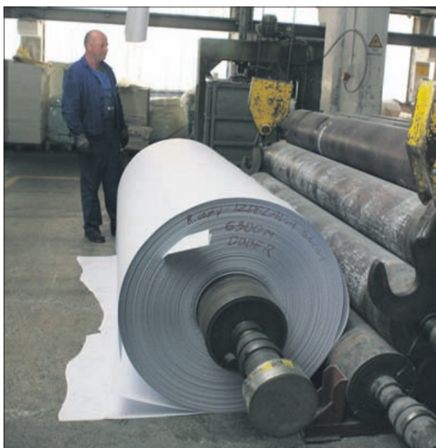
Bodo stroji v radeški papirnici v resnici znova delovali?