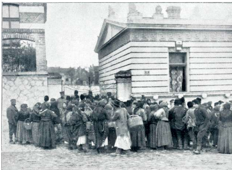
PRED LAZARETOM V BELGRADU.

prišlo nekaj grških majhnih vojnih ladij — velike niti v pristan ne morejo, ker je plitev — in so odpeljale vjeto turško posadko.