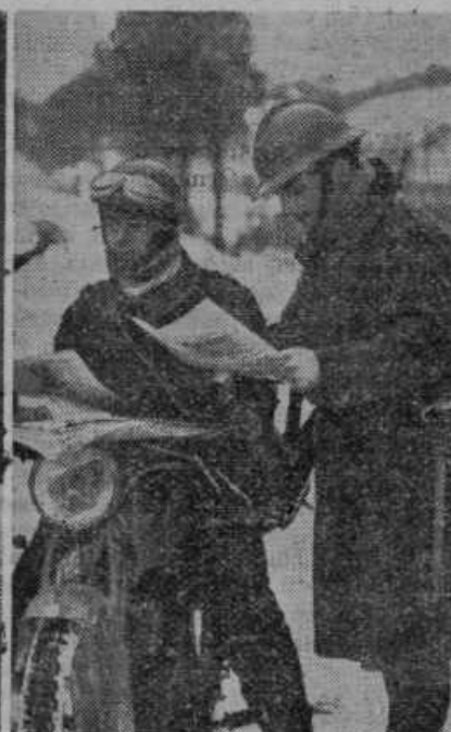
Francoski vojaki prevažajo na bojišče časopise na motorjih

ki se borijo zoper njega in nas zatirajo. Bog jih bo udaril.«