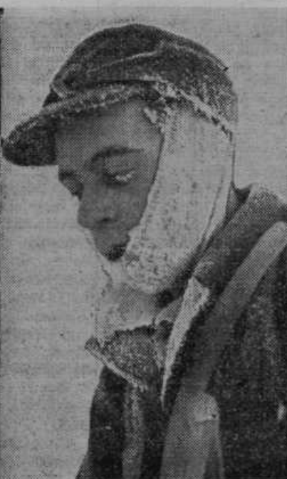
Na Finsko prihaja vse polno prostovoljcev: švedski prostovoljec