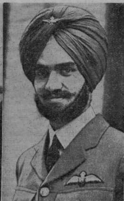
Letalski častnik iz angleške Indije na zapadni fronti