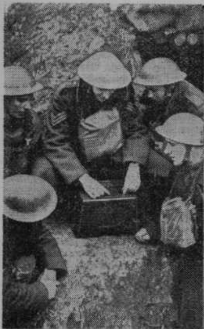
Angleški vojaki na zapadnem bojišču poslušajo radijska poročila

2. Leto za letom stavijo naše kmetijske organizacije predloge, da se zajec, največji škodljivec sadjarstva, izloči iz lovske zaščite.