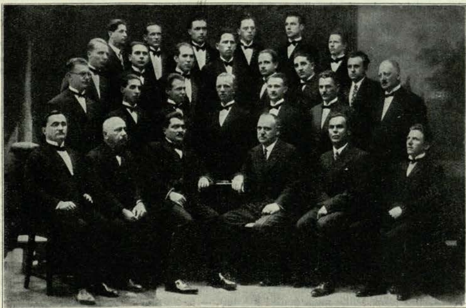
Pevski zbor «Grafika».

Narod poje. Zbirka priljubljenih slovenskih narodnih napevov za klavir in petje. Pod gorenjim naslovom je Učiteljska tiskarna v Ljubljani izdala in založila novo, bogato zbirko