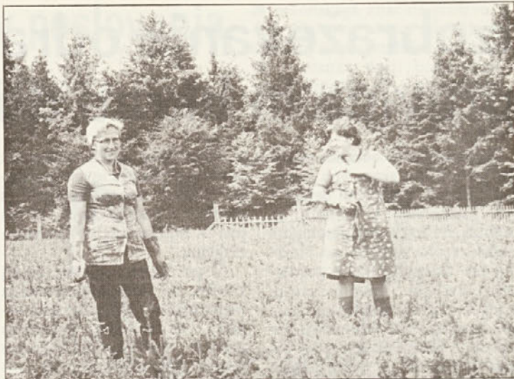
Delavki sta se za hip zravali od pletve štiriletnih sadik v drevesnici Struga.