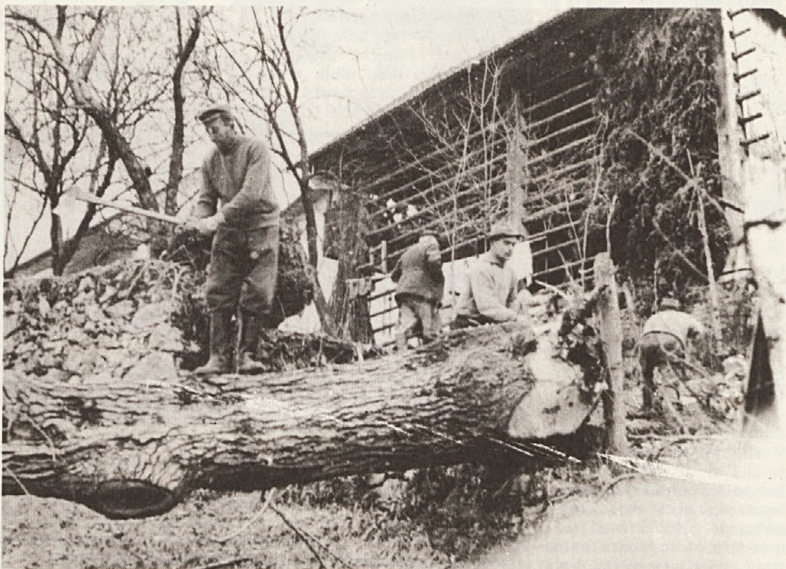
Z mehanizacijo v gozdarstvu smo napredovali in še napredujemo. Za podiranje oreha pa je običajno le potrebno še več moč. (Foto Uroš).

Zaradi spoznanj o pomenu znanja, ki je osnova za pravočasno in kakovostno opravljeno delo, smo se z večjim optimizmom lotili načrtovanja izobraževanja v naslednjem srednjeročnem načrtu. V obdobju 1981 – 1985 bomo sprejeli na novo v delovno organizacijo 6 dipl. gozd. inženirjev, 7 gozd. inženirjev, 20 gozdarskih tehnikov, 75 gozdnih delavcev, 18 traktoristov, 9 šoferjev, 3 kuharice, 1 snažilko, 2 dipl. ekonomista, 10 ekonomistov, 9 ekonomskih tehnikov, 4 strojepiske, 2 mine-rja, 1 gradb. delovodja, 9 cesta-