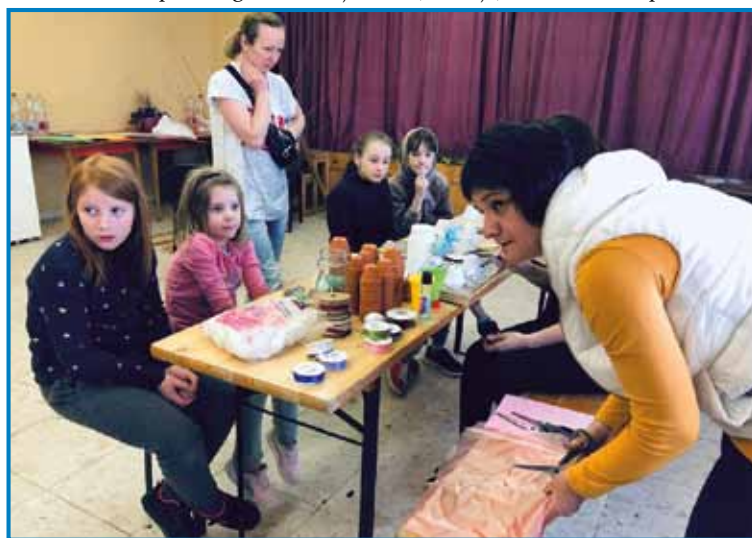
Na drüdjji den, kak so begunci prišli, v soboto na vüzemski delavnici mlada ukrajinska mati svojo čerdjau pa njeno padaštjinjov

žensk je vtjüpprišlo, velko delo nas je čakalo. Lüstvo nam je teko vse vtjüpdalo! Od djesti, do butora (pohišta), gvante za mlajše pa völtje, posteljno pa drugo vse! Tej mladi,