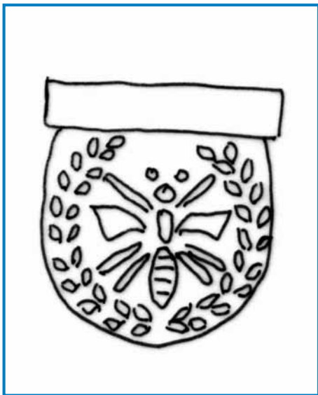
»Koteu« gorjuške fajfe – dostakrat so ga okinčali z motivom fčele, kauli nje pa s tzv. »ušmi« (falati bisera)

priliko napravljena v formi edne rauke, štera drži pipin koteu. V novejši časaj so se fajfarge trūdili, ka bi vōnajšli nauve forme: takša je bila med drūgimi »djagarska fajfa«, pri šteroj je bila cejv nutdjana v edno srnjakovo orau. Kauli gorenjske vesnice Moravče so tō rēdili pipe, samo nej tak na veuko. Nej so je tak sploj okinčali, so pa je vōzrezali v formi stvarin (psa, mačka, kokauta,