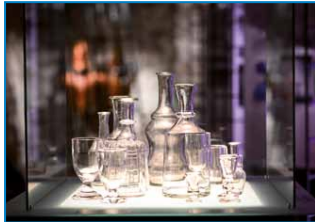
Detajl z razstave 2