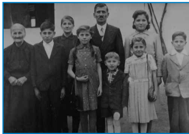
Njina družina v Sakalavci je vólka bila. Bilau nji je osem mlajšov. Na kejpi stara baba, mati (Lina tetica) oče (Cica bači) pa šest mlajšov

»V kosavnoj fabriki, dja pa v židanoj fabriki dočas, ka so me nej taposlali. Potejm sem v več mejstaj delala, največ v Meriki.«