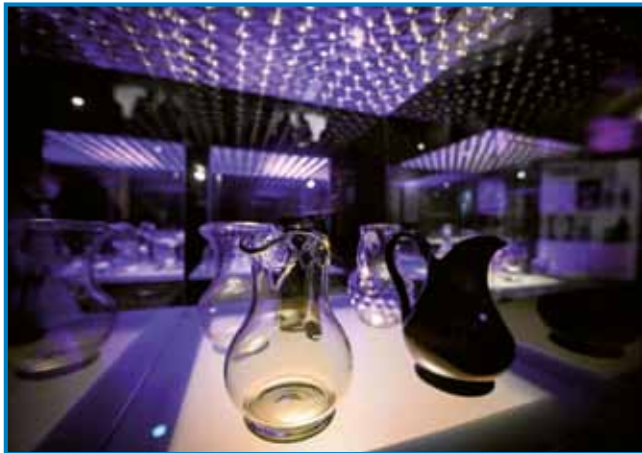
Detajl z razstave 1

Pohorsko steklo hranijo tudi različni muzeji po Sloveniji in v tuj-