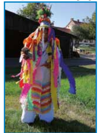
Gorzravnani kak pozvačini

Zatau ka je Lipa znana po krumplinaj, organizerajo tudi dve prireditvi, sterivi sta povezani s tem pauvom. Prva je langašijada, tekmovanje v peki langaša, stero turistično društvo organizera prvo nedelo v meseci junijuši, fotbalski klub pa meseca julijuša pripravla Krumplovo nauč. »Radi demo na izlete in srečanja, pa tudi na prireditve ob svetovnom dnevi krumplinov. Ovači pa naše turistično društvo skrbi tudi za tau, ka je naša vesnica, v steroj žive okauli 600 lidi, lepau vrejdvzeta. Sadimo rauže in lepšamo okolico. Mam pa tudi plane, ka bi vrejdvzeli ške središče kraja. Tü je tudi športno igrišče, pri steroj do se vrejdvzele nauwe slačilnice, pauleg toga pa mo napravili ške en pokriti prireditveni prostor, tak ka nam te nede več trbelo postavljati šatorov, gda mo meli kakšo vekšo prireditev. Pauleg toga