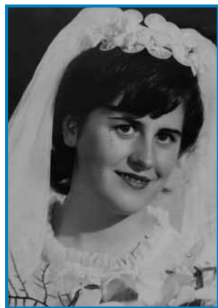
Erži kak sneja

»Dja sem sedma bila, od mene je samo eden pojep