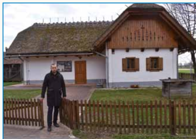
»Morem povedati, ka si v naši vesnici vsi pomagamo« stran 6