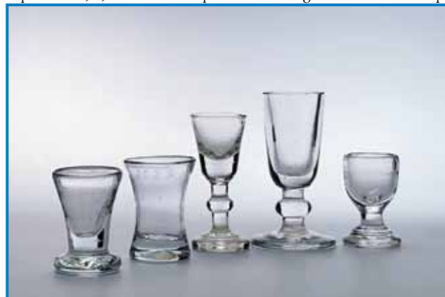
Šilca, pohorsko steklo