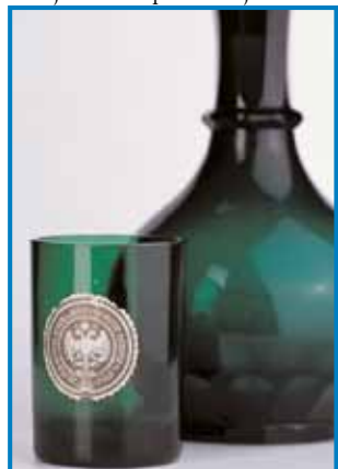
Kozarec in karafa, Stekl. grofa Zabea

stavljeni izdelki pohorskih steklarjev iz bogate muzejske zbirke pa bodo na ogled vse do 14. maja, v pritličju grajske bastije.