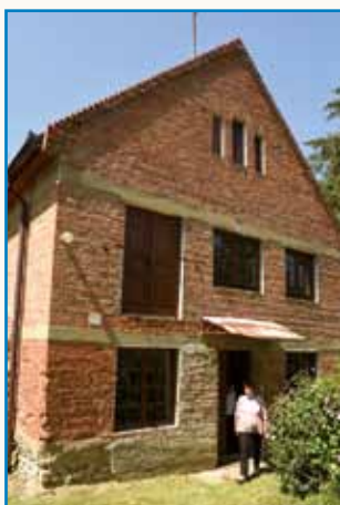
»Ka se leko napravi, ...« stran 45