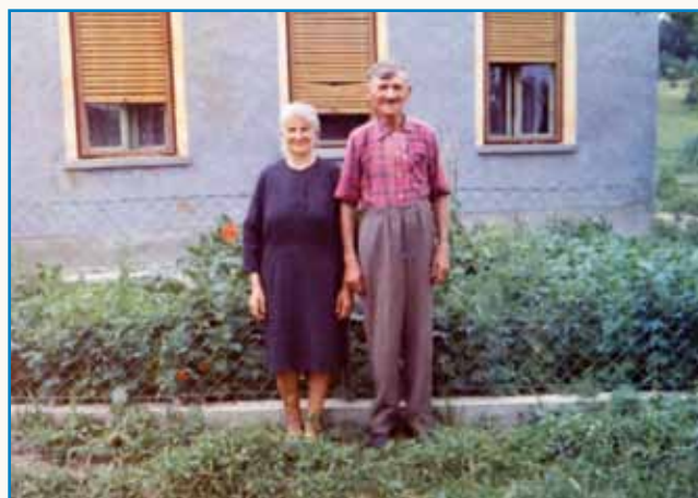
Žir, krij pa mesau je zaprejo bilau stran 8