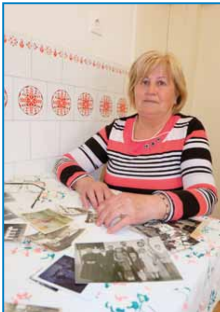
Erži je dvanajsetkrat po pau leta delala pri sestri v Meriki. Sestrina družina je tam pekeraj mejla

»Osem nas je bilau mlajšov, zvün nas te še oča, mati, baba pa dejdek sta z nami živela, vsevküp nas je dvanajset bilau. Tau, ka nas je tak dosta, se je najbola vsigdar te vidlo, gda smo k stauli vseli.«