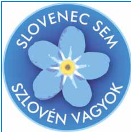
DSS se na gesensko vküppisanje lüstva pripravla s slovenskim simbolom spominčice - ka aj bi se s kem več ljudi »spomnilo«, ka so Slovenci

»Brž moremo zmišlavati, ka letos do že penezge. Več lüstva more vtjüpsesti, ka zdaj rejsan za cejlo Porabje dé. Smo že več djilejšov meli pa na pamet vzeli, ka nemamo gotove načrte.