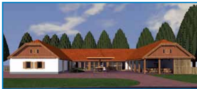
Tak aj bi vövidla žganjarna v Števanovci po tistom, ka bi go dala DSS obnauviti - tam aj bi se küjala palinka in rédo tikvin oli

Letos oktaubra in novembra do vküppisali lüstvo na Vogrskom. Moremo prej pokazati, ka nas je nej tak malo, in znamo vküper staupiti, je vöpostavo predsednik DSS. Krovna organizacija je že v lanjskom leti pripravila promocijski material za ljudsko