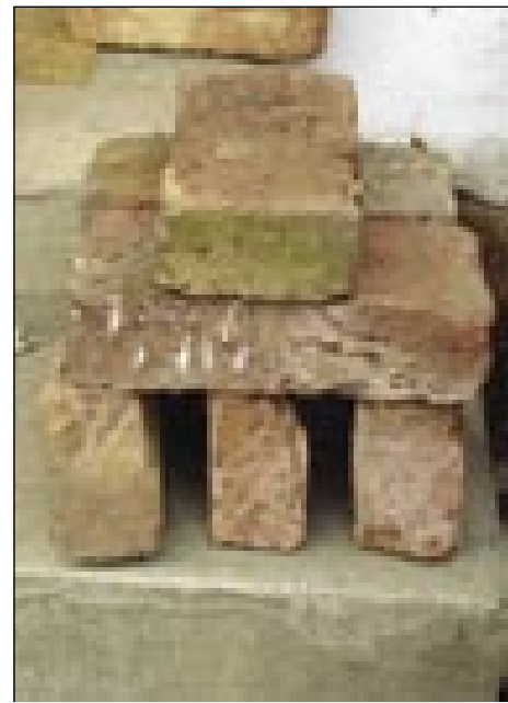
Tak so cüggle vküpsklali, naj leko dim pa ica med njimi oj dita

• Te ciglar je cejli čas tam bejo, dočas so s cüglemi delali?