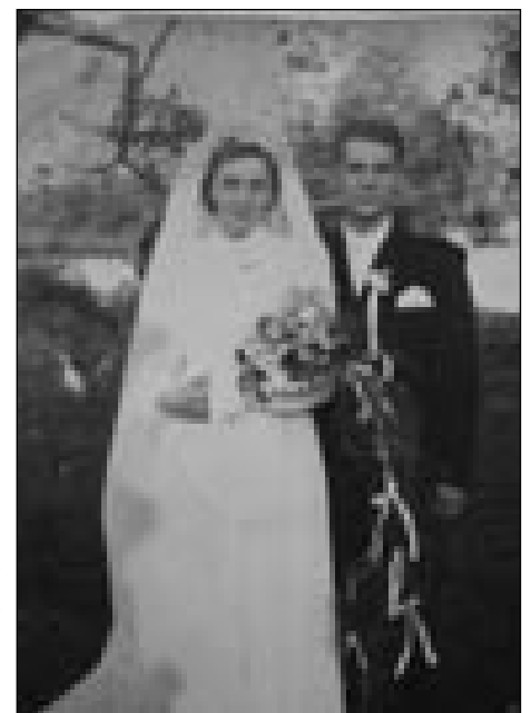
Zdavanjski kejp iz leta 1954.

1954. leta majuša sva se oženila z mojim lübinom. Meni