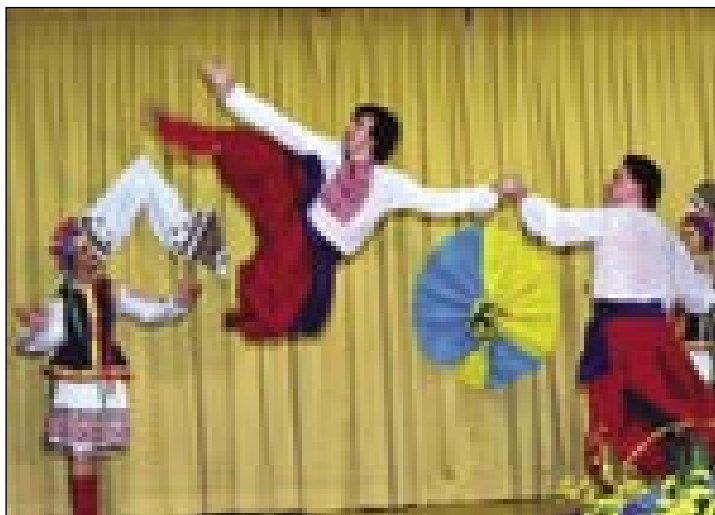
Ukrajinski ples je včasí akrobatičen

ziki tó. Zvekšoga so tau plesi, takzvane kolomijke . Vaugri so več stoletij spejvali njine melodije, štere so do gnes dobile vogrsko formo. O tem je piso erični vogrski skladatelj (zeneszerzö) Béla Bartók, pa gorprišo, ka so vorgske naute od svinjski pasterov gratale iz ukrajinski kolomijk. Bartók je eške pred prvov bojnov odo v Ukrajini, pa gorspiso 80 ukrajinski pesmi, depa knige so iz njé nikdar nej gratale. Takše vogrske naute so tó, štere so samo nauve reči dobile, ovak so spoj gnake z ukrajinskimi (takše so ništerne kozaške