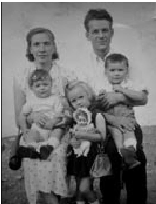
Z najstarejšo hčerjav pa dvōma sinoma

eden moški, ka nam je samo srpé pa očke brüso, ka smo te ležej travo pa trnje kosili. Gda smo v takšno lino prišli, ka je