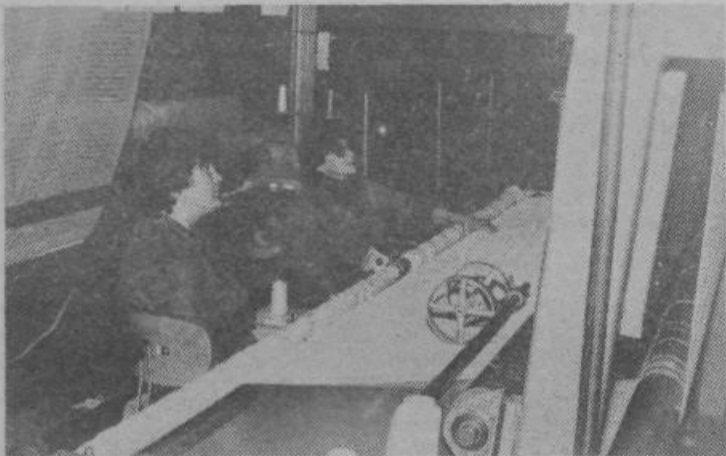
Pregled surovega blaga. Vse napake na zavesi takoj zvedo v proizvodnji.

● NAŠI DELOVNI LJUDJE IN OBČANI O SEBI IN O SVOJEM DELU