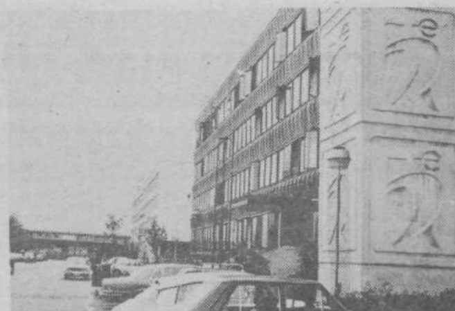
Poslovna stavba Intereurope - filiale Ljubljana