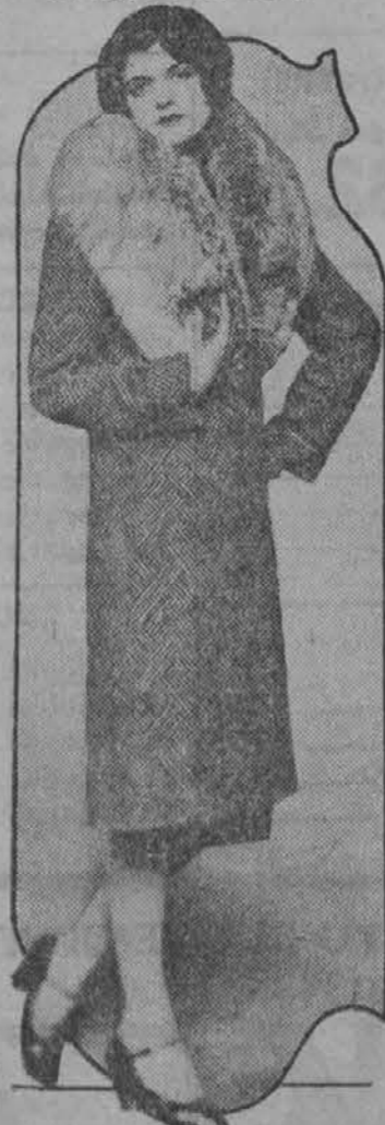
A nice fur collar sets off any coat, and the bigger it is the better it does it. This tweed coat with billowy fur is one of the latest creations for cold weather.