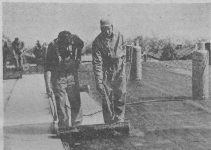
Delavci Tectuma delajo ravno streho na poslopju športne dvorane Kodeljevo