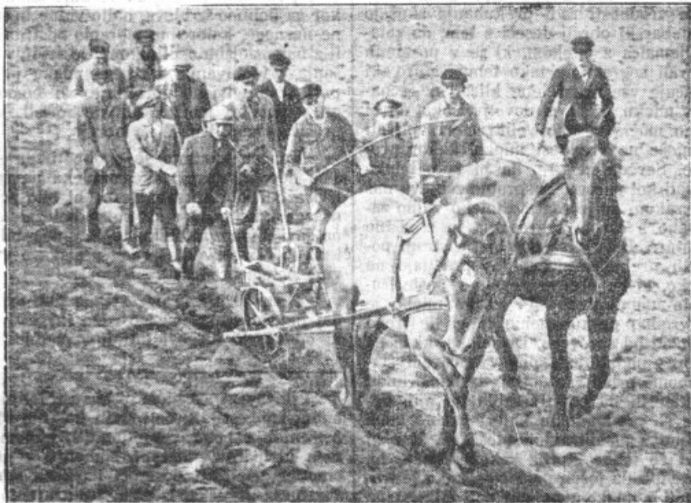
Nazaj na deželo! — Orati ni lahko — treba se je učiti.

Mariborski svinjski sejem. Na svinjski sejem dne 29. aprila je bilo pripeljanih 215 svinj, cene so bile sledeče: Mladi prašiči 5—6 tednov stari, komad 40—70 Din, 7—9 tednov stari, 90 do 110 Din, 3—4 mesece stari 150—250 Din, 5—7 mesecev stari 300—320 Din, 8—10 mesecev stari 400—450, 1 leto stari 600—800 Din, 1 kg žive teže 5—6 Din, 1 kg mrtve teže 7.50—9 Din. Prodanih je bilo 172 svinj.