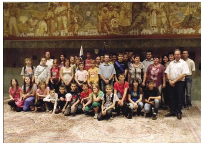
V stavbi slovenskega državnega zbora

trku peljali do majhne kraške vasice Tomaj, kjer smo si ogledali Kosovelovo domačijo s spominsko zbirko o pesniku Srečku Kosovelu in njegovi družini. Spominska zbirka je postavljena v hiši, v kateri so predmeti in so predstavljeni vsi člani družine. Potem smo nadaljevali svojo pot v smeri prestolnice