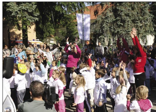
Skupno razgibavanje pred tekmovanji

začetku prireditve je zbrane pozdravila ravnateljica vrtca. Vrtci so se predstavili v sprevedu ob olimpijski himni, ki je bila pripravljena posebej za to prireditev. Otroci so slovesno prinesli olimpijsko zastavo in jo dvignili. Pred začetkom tekmovanja smo se razgibali ob glasbi pod vodstvom trenerke otroške aerobike in tako so bili otroci pripravljani na tekmovanje. Preizkušali so se in tekmovali v različnih športnih panogah: tek, kolesarjenje, vožnja s skirojem in triciklom, skok v višino in daljino, spretnost z obroči, metanje žoge, spretnostni poligon itd.