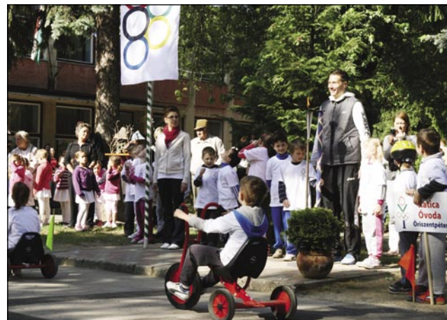
Slovenski dvig olimpijske zastave

Kot slovenska vzgojiteljica asistentka v porabskih vrtcih sem se udeležila prireditve in spremljala skupino otrok. Na Otroški olimpiadi je sodelovalo več kot 400 otrok iz 11 vrtcev monoštrske mikroregije. Vsak otrok je dobil olimpijsko majico. Na