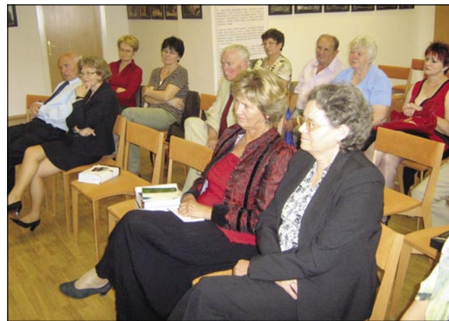
Na srečanje je prišlo več sombotelski Slovincov tō

»Na oprejtom tiri« (Nyílt pályán). V njoj najdemo »blaudnje« z mladi lejt (življenjske kejepe z Beograda, Londona ali Pariža), depa važna pitanja z manjšinsko tematiko ranč tak. Leko na priliko preštemo, kak je slovenski pisateu Drago Jančar polemizero z avstrijskim pisatelom Petrom Handkejom, gda je Slovenija grtūvala sam svoj rosag. Dosta leko zvejmo o mišljenji avtora o revoluciji na Romanarskom leta