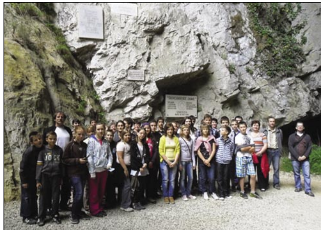
Učenci in učitelji pred Škocjansko jamo

prostoru smo si ogledali kratak film o parku in fotografisko razstavo iz časa družine Scaramanga. Družina Scaramanga je v park zasadila