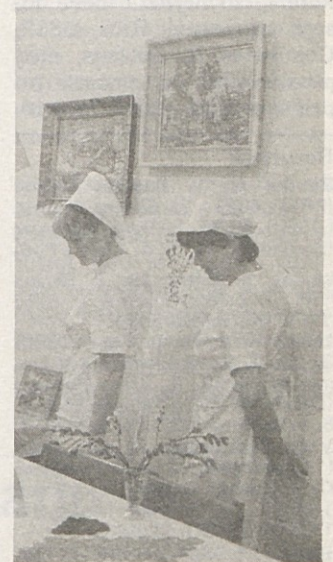
Delavke Gostinske enote so ob 8. marcu pripravile razstavo ročnih del.