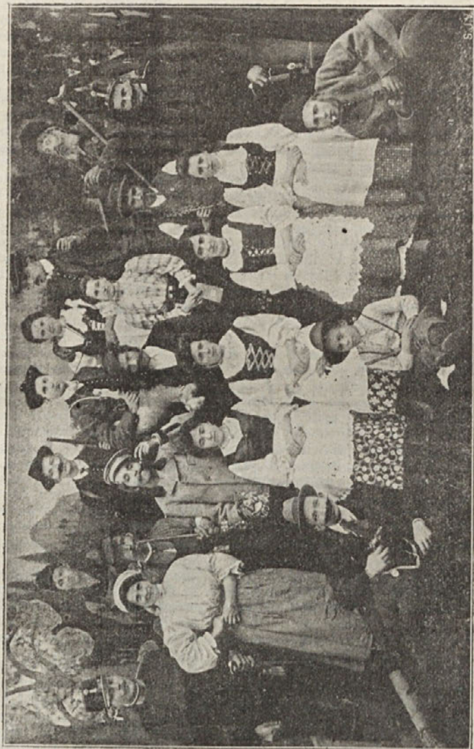
Iz igre: Divji lovec. (Mozirje).