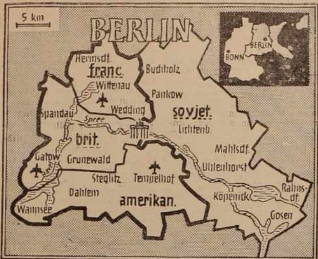
RAZDELJENI BERLIN — Risba prikazuje sovjetski in zahodni britansko-ameriško-francoski sektor mesta. Celotno mesto obdaja ozemlje Vzhodne Nemčije, zato so si zahodni zavezniki zagotovili v statusu Berlina določene proge in prekope kakor tudi »zračni« moste za prevoz živil, ostalih potrebščin in ljudi.

Na Zahodu groze s sankcijami. Bonn baje namerava pričeti gospodarsko blokado. Vendar vse kaže, da zadeva ne bo tako tragična. Če naj ta ukrep sproži zahtevo, da se o berlinskem vprašanju pomenijo za »zeleno mizo«, bi ga lahko celo »pohvalili«. Jasnno pa je, da se nemškega vprašanja morajo lotiti iz vseh vidikov in pri tem uporabiti precejšnjo dozo vzdržnosti in popustljivosti. Preostanejo torej le pogajanja kot edino pametno sredstvo, ne pa pritisk in grožnje.