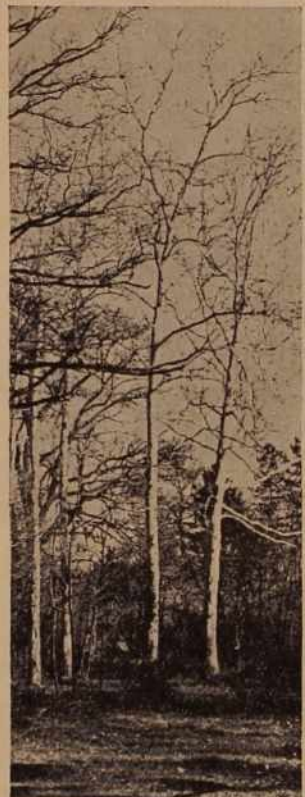
Prve megle v avgustu so kakor pravijo stari ljudje — znanilke jeseni. Za tem pritisne prva slana in listje bo pričelo odpadati. Kako hitro se leto obrne!

Vaščani Šalovec so pred kratkim izdelali za prizidek šole 95 tisoč kosov opeke, ki so jo v teh dneh začeli žgati. Opeko so izdelali s prostovoljnimi delom. Kakor je znano, bodo s tem prizidkom dobili v Šalovcih popolno osemletno šolo.