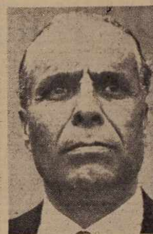
nemogočiti. Domačini so se zbrali tudi pred hišo, v kateri bo prvak po sklepu oblasti v prihodnje stanoval.

Kenjato je ob prihodu na letališče Kahava pri Najrobiju pozdravilo nekaj tisoč ljudi, čeprav je policija hotela demonstracije o-