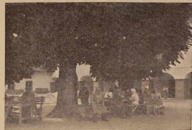
Tudi v Domu onemoglih v Rakičanu je poletje, zato se njegovi stanovalci najraje zadržujejo v senci košatih kostanjev, ki dajejo prijeten in osvežujoč hlad

KRIŽEVCI PRI LJUTOMERU - V kmetijski zadrugi v Križevcih pri Ljutomeru se temeljito pripravljajo na jesensko setev. Od 20. do 27. avgusta bodo imeli teden kooperacije. V tem času bodo kmetijski strokovnjaki s pomočjo ostalih uslužbencev obiskali vsakega proizvajalca na domu in se pogovorili o sorti, semenu, gnojenju in podobno.