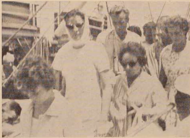
Ladja je pristala. To pomeni za marsikoga začetek novega življenja