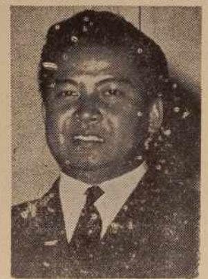
Princ Sihanuk, šef Kambodže

V deželi ima glavno besedo narodnosocialistična skupnost, četudi ostale stranke niso prepovedane. Oblast je centralistična, ven-