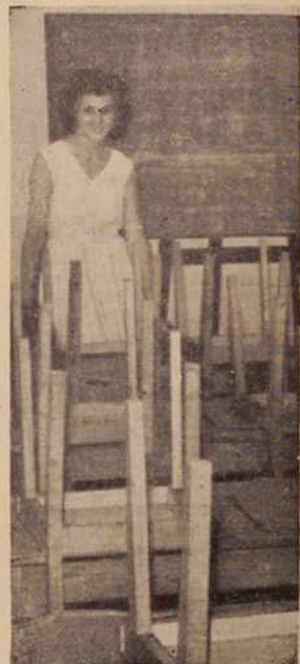
Se dobre tri tedne nas loči od priletka pouka na šolah. Stoli, ki so jih ob koncu šolskega leta takole pospravili, bodo spet »zaživeli«.