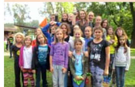
Ekipne šolske državne prvakinje