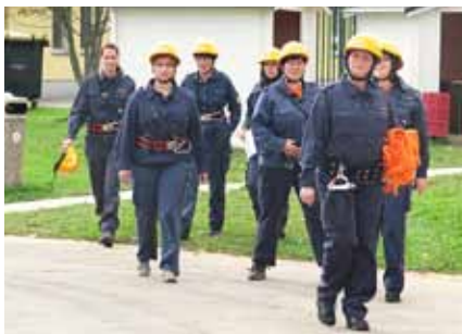
Dekleta v akciji

V tekmovalni ekipi je sedem članov, vključno z voznikom, ki poleg izvedbe