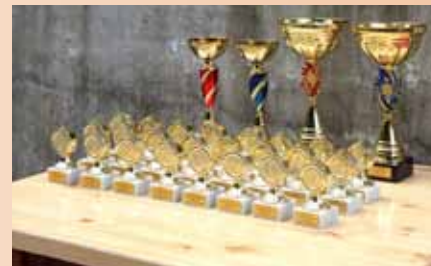
Naslednje leto bodo še lepši ...