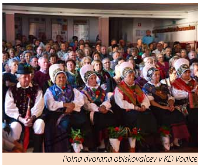
Polna dvorana obiskovalcev v KD Vodice