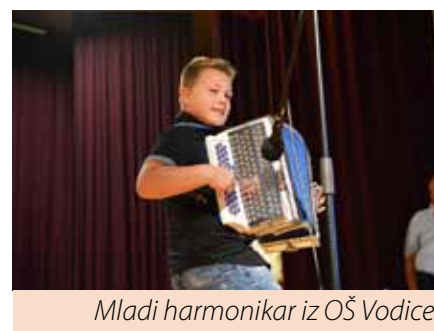
Mladi harmonikar iz OŠ Vodice