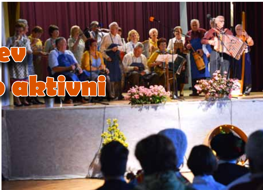
Nastop skupine DU Vodice