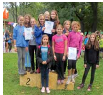
2. mesto ekipno dekleta B