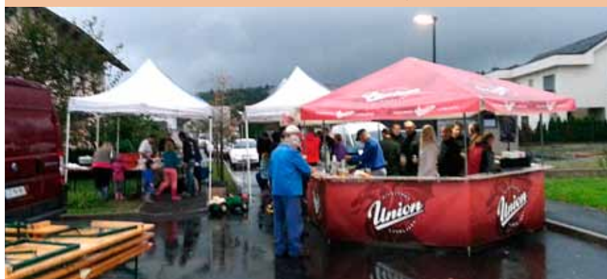
Piknik in druženje