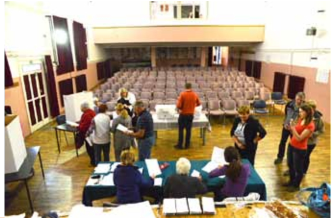
Občinska volilna komisija pozorno spremlja volilne upravičence, jim pomaga ob morebitnih zadregah in na koncu vestno prešteje volilne lističe.