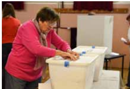
No, bo šel noter ali ne?!