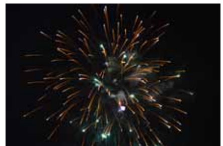
...in ko je bilo jasno, je nebo razsvetlil ognjemet! Ostaja županova obljuba, da bo tudi naslednja štiri leta posegal po zvezdah, četudi preko trnja.