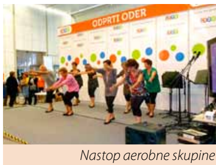
Nastop aerobne skupine