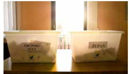
Največ mest v Občinskem svetu, in sicer po štiri, sta osvojili Lista Srce občine Vodice in Lista neodvisnih krajanov. NSi in SDS bosta imeli po tri svetnike, SD pa enega.