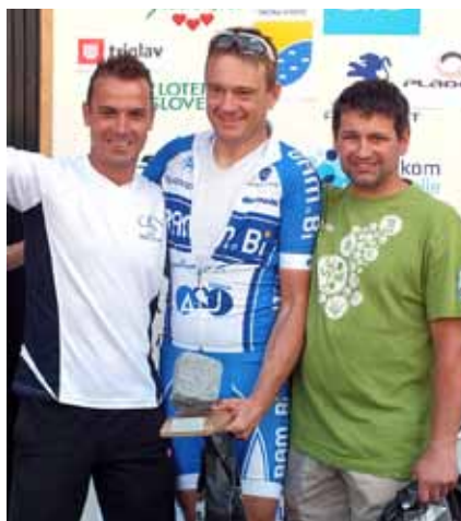
Najhitrejši z dirke za občinsko prvenstvo