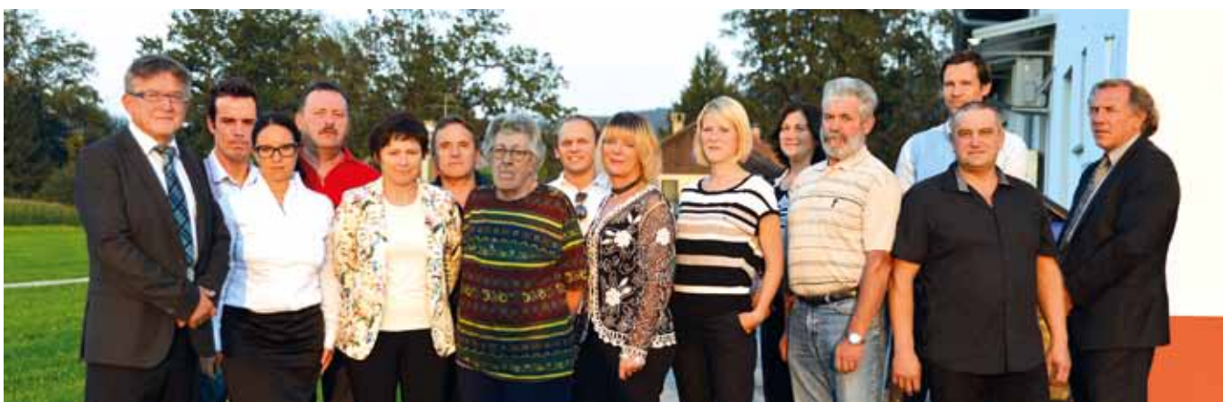
Letošnji svetniški kandidati Liste neodvisnih krajanov

Na lokalnih volitvah 2014 za člane Občinskega sveta Občine Vodice je LISTA NEODVISNIH KRAJANOV prejela največ glasov med vsemi listami in političnimi strankami. Torej smo zmagovalci letošnjih svetniških volitev . Za tako res izjemno podporo se vam, spoštovani volivci, iskreno zahvaljujemo. Še posebej se zahvaljujemo občanom, ki ste s svojim podpisom pred državnimi organi omogočili našo neodvisno kandidaturo, in seveda vsem 15 prijateljem, ki ste se zavzeto odločili kandidirati na naši listi.