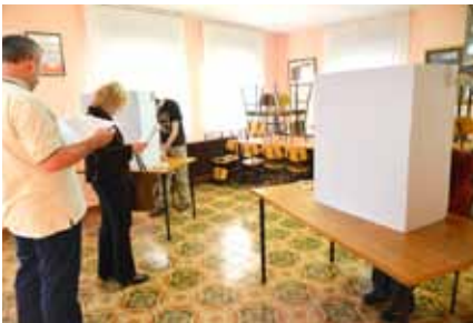
Še zadnji premislek pred odločitvijo in vprašanje, kdo si zares zasluži moj glas?!