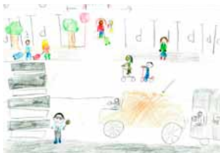
Maša Gregorc – 1. mesto natečaja

Vsem nagrajenkam na natečaju iskreno čestitamo.