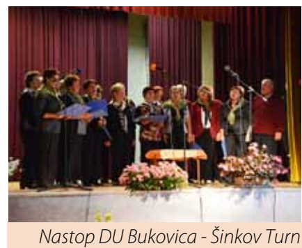
Nastop DU Bukovica - Šinkov Turn