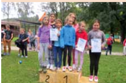
2. mesto ekipno dekleta A

Fantje so ekipno v kategoriji B (6. in 7. razred) osvojili 4. mesto.