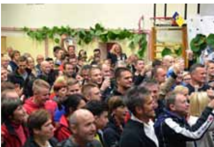
Takole so nazdravili novemu staremu županu ob prvih neuradnih rezultatih.