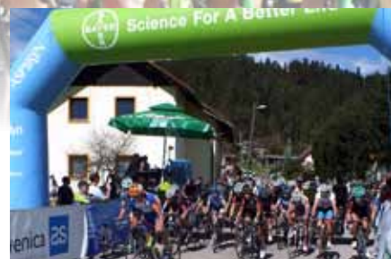
Utrinki s kolesarske dirke

Pri izvedbi tekmovanja so bili organizatorjem v veliko pomoč člani PGD Šinkov Turn, ki so skrbeli za varnost na trasi dirke, kakor je bilo že omenjeno, pa je bil na njihovem zemljišču tudi osrednji prireditveni prostor. Omeniti velja tudi prijaznost in uvidnost domačinov ob progi, ki so morali vsaj nekatera siceršnja opravila in načrte prilagoditi dogajanju na bližnji cesti, po-