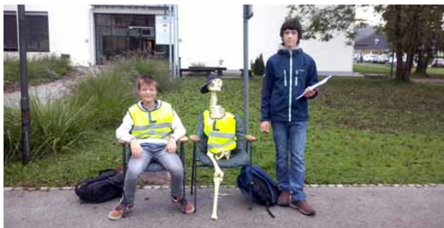
Štetje prometa pred OŠ Vodice