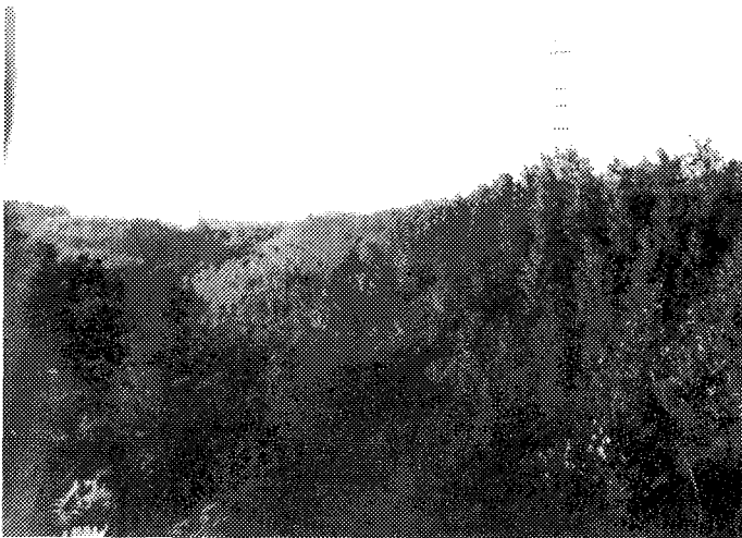
Sl. 2. Izgled kose površine deponije pepela posle rekultivacije. Fig.2. Inclined ash deposit after recultivation.