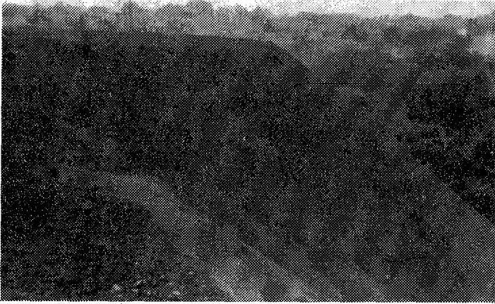
Sl. 1. Izgled kose površine deponije pepela pre rekultivacije. Fig.1. Inclined ash deposit before recultivation.