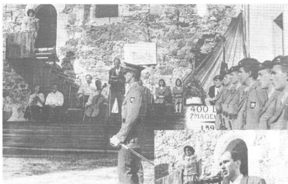
Častna četa slovenske vojske ni prisostvovala samo prireditvi kot taki ampak tudi povišanju najvišjih častnikov