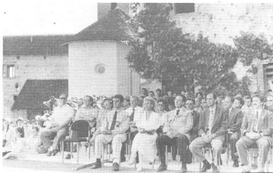
Med številnimi obiskovalci je bil tudi nemški vojaški ataše ter potomci družine Auerspergov – nekdanjih lastnikov gradu