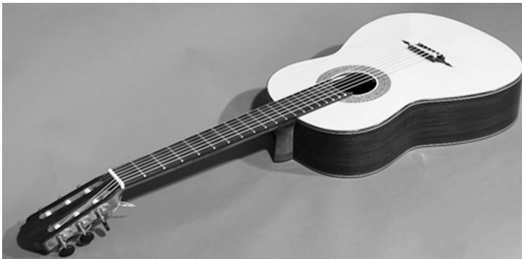
Slika 9: Kitara Šali Double-top smreka