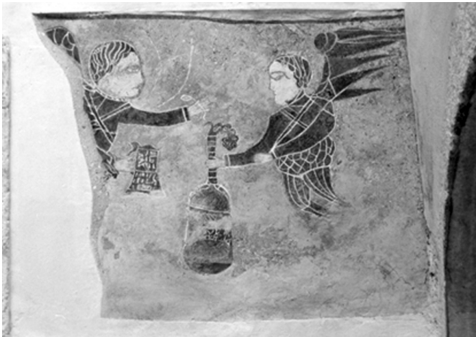
Slika 1: Freska z gradu Podsreda.