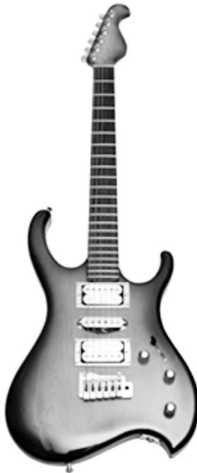
Slika 11: Unikatna električna kitara Davorina Severja.