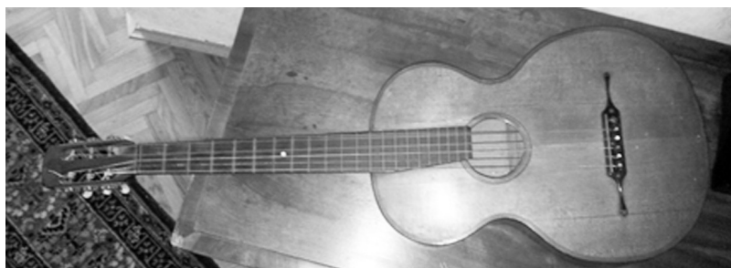
Slika 2: Kitara neznanega mojstra s konca 19. ali začetka 20. stoletja, ki jo hranijo v Pokrajinskem muzeju Ptuj - Ormož.

Najstarejše ohranjeno znano brenkalo na naših tleh je ohranjeno v Pokrajinskem muzeju Ptuj-Ormož. To je lutnja, ki jo je leta 1694 na Dunaju izdelal Andreas Berr. 14 V istem muzeju je razstavljena tudi kitara neznanega mojstra iz druge polovice 19. ali prve polovice 20. stoletja. Sicer pa je najstarejša znana in ohranjena kitara na Slovenskem izdelek Nicolasa Georga Reisa iz okrog leta 1820, hranijo pa jo v Pokrajinskem muzeju v Celju. 15