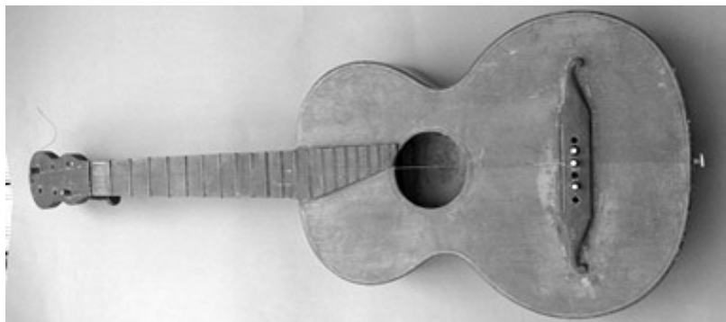
Slika 3: Kitara Nicolasa Georga Reisa iz približno 1820.