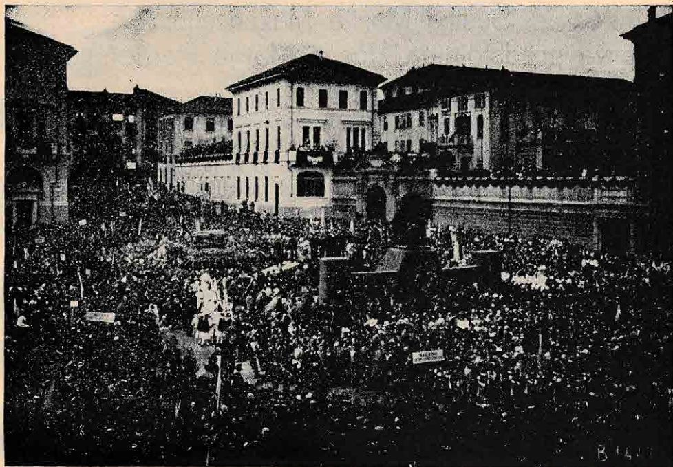
Urna s telesnimi ostanki bl. Janeza Bosca na trgu Marije Pomočnice.

Benedkam. Spotoma smo od daleč pozdravili v Padovi sv. Antona, ki ima tam krasno cerkev.