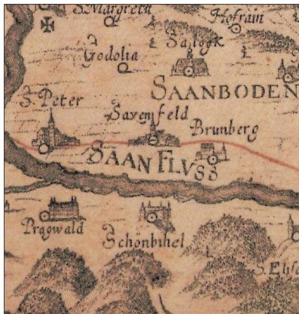
Slika 1: Žalec (Saxenfeld) in Plumberk (Brunberg) na zemljevidu Štajerske. Georg Matthäus Vischer, Styriae Ducatus Fertilitissimi Nova Geographica Descriptio, 1678, izrez (Wikimedia Commons).

V srednjeveški in zgodnjenovoveški Evropi sovražnost (lat. inimicitia , nem. Feindschaft itd.) ni označevala zgolj čustva jeze ali sovraštva (npr. lat. ira in odium , nem. Zorn in Haß ), čeprav je bila z njima tesno povezana, 4 temveč predvsem formaliziran javni odnos vzajemnega nasprotja oziroma spora med posamezniki, rodbinskimi idr. skupinami. V tradicionalnem reševanju sporov je bil koncept sovražnosti tesno povezan z nasilnim povračilom za krivico, torej z maščevanjem v ožjem pomenu. Starogermanski izraz za ta odnos