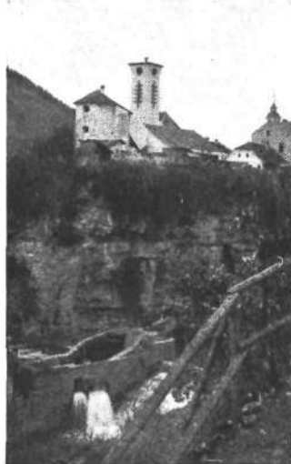
Pungeri iz globeli Kokre