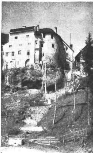
Severni del mestnega obzidja v Kranju