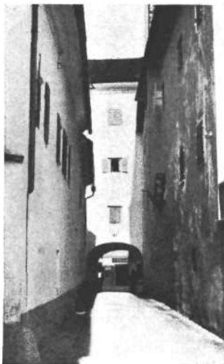
Prehod iz grajskega v meščanski del naselbine Kranja