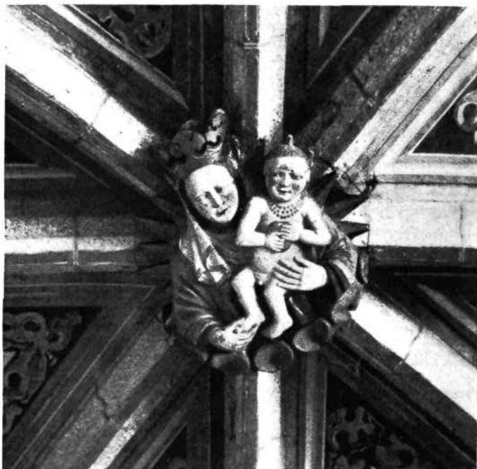
Župna cerkev v Kranju: Sklepnik iz 2. pol. XV. stol.

L. 1507. je bila kranjska župnija še zasedena. Šele po smrti župnika Operte je naročil cesar Maksimili-