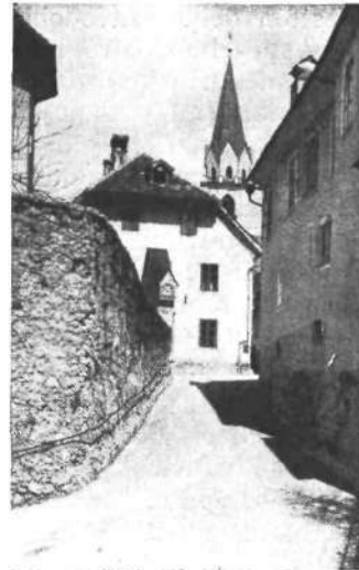
Mesni zid pri bivših vodnih vratih

škofov meščani spominjali, da so imeli baje pravico prezentirati vikarja za kranjsko župno cerkev, toda listin niso mogli več najti v arhivu. Nasprotno pa jim je ljubljanski škof takoj postregel z reverzom iz leta 1601., v katerem so se odrekli vsem pravicam iz omenjene listine.